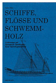
Daniel L. Vischer: Schiffe, Flösse und Schwemmh Holz. Unterwegs auf Schweizer Gewässern. Eine Technikgeschichte. Hier und Jetzt, Baden, 2015, 352 S., CHF 59.–

Dampfschiffe kennen alle – es gibt aber noch viel mehr: Einbäume, Treideln, Weidlinge, Kriegsschiffe, Galeeren, Waschschiffe, Schiffmühlen, Flussfähren ... Daniel L. Vischer weitet mit seinem technisch-geschichtlichen Übersichtswerk den Blick. Er beschreibt die Aufgaben und die Technik der früheren schweizerischen Fluss- und Seeschifffahrt. Anhand zahlreicher Illustrationen und Anekdoten wird die Entwicklungsgeschichte der Wasserfahrzeuge erklärt, welche einst einen bedeutenden Teil des Güter- und Personenverkehrs auf den schweizerischen Gewässern bewältigten. Gleichzeitig wird deren zivilisationsgeschichtliche Bedeutung aufgezeigt. Im Vordergrund liegen Holzschiffe und Flösse, wobei auch auf die Wandlung und Funktion der Wasserwege sowie auf Spezialschiffe eingegangen wird. Dieses äusserst interessante Werk wird insbesondere jenen empfohlen, welche sich für die Konstruktion und die Einsatzmöglichkeiten der früheren Wasserfahrzeuge und die Nutzung der schweizerischen Gewässer interessieren. Michèle Bless