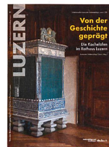
Kantonale Denkmalpflege Luzern (Hg.): Von der Geschichte geprägt. Die Kachelöfen im Rathaus Luzern. Schriftenreihe Kantonale Denkmalpflege Luzern, Luzern 2015, 156 S., CHF 45.–

Im Luzerner Rathaus stehen sechs Kachelöfen aus dem 18. Jahrhundert – drei Kastenöfen und drei wuchtige Turmöfen. Sie sind nicht nur Heizkörper, sondern wesentlicher Schmuck der Räume. Die zwischen 2011 und 2013 umgesetzte Konservierung, statische Sicherung und schrittweise Restaurierung der historischen Öfen war eine anspruchsvolle Aufgabe. Dank der neuen, fein regulierbaren Heiztechnik (mithilfe moderner Infrarotstrahler) dienen die wertvollen Zeugnisse vergangener Hafnerkunst heute wieder der ausgewogenen Beheizung der Räume, ohne dass Einbussen an Komfort und Behaglichkeit in Kauf genommen werden müssen. Die von der Kantonalen Luzerner Denkmalpflege herausgegebene Publikation gibt nicht nur Einblick in die gelungene Restaurierung der Kachelöfen und die daraus gewonnenen Erkenntnisse, sondern vermittelt auch die 400-jährige Bau- und Restaurierungsgeschichte des Rathauses – eines Gebäudes von grosser Bedeutung für die historische, politische und touristische Identität von Luzern. Peter Egli