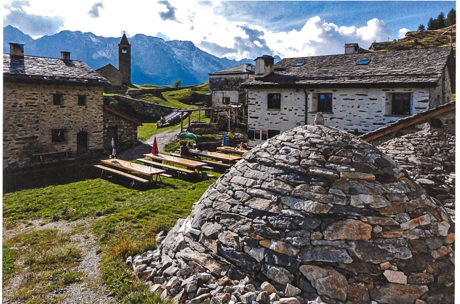
Im Vordergrund der perfekt wiederhergestellte Crot, rechts dahinter sein älterer Zwilling, im Mittelgrund der Halbkreis der Alpgebäude mit dem Wirtshaus rechts und im Hintergrund die 1106 erstmals erwähnte, romanische Wallfahrtskirche San Romerio.

Die Wiederherstellung dauerte fast vier Jahre und musste neben den normalen