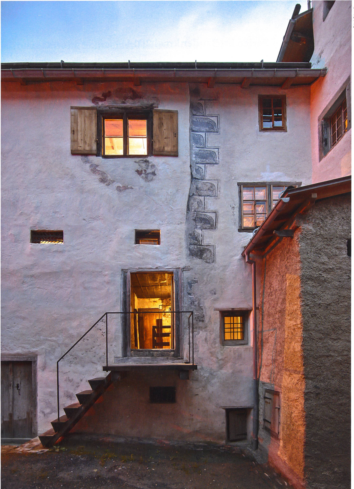
Das von den Architekten Capaul & Blumenthal sorgfältig instand gestellte Türalihus in Valendas GR steht seit Ende Oktober 2014 für Ferien im Baudenkmal zur Verfügung.