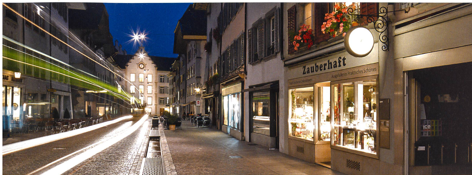
Aarau erhielt 2014 den Wakkerpreis des Schweizer Heimatschutzes.