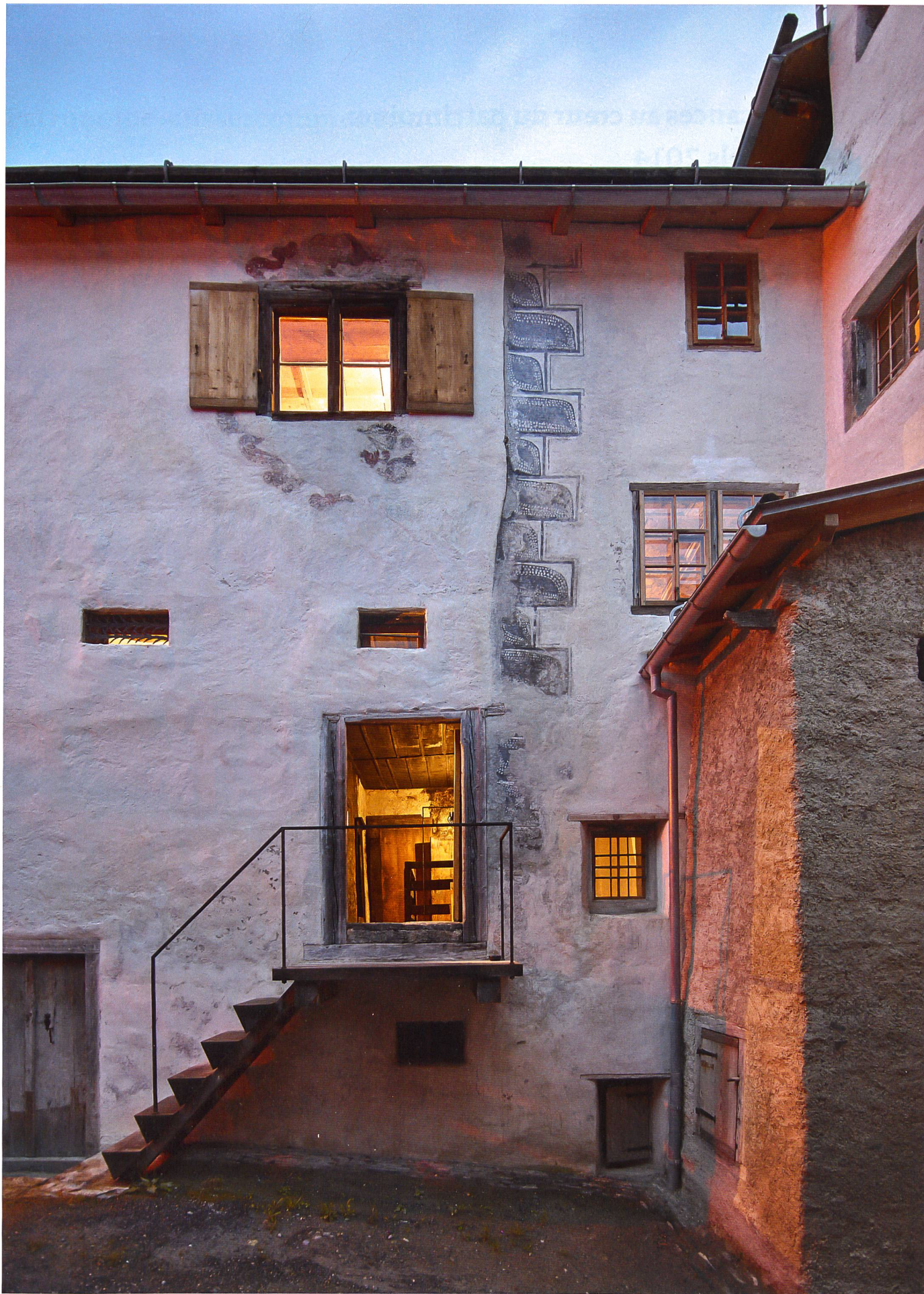
Depuis la fin octobre 2014, Vacances au cœur du patrimoine propose la location de la Turalihus de Valendas (GR), remise en état dans les règles de l'art par les architectes Capaul & Blumenthal.