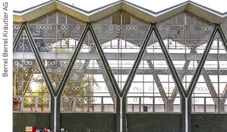
Berrel Berrel Kräuter AG

Aufgrund der weit herum anerkannten architektonischen Qualität des Kraftwerks Birsfelden erhob der Baselbieter Heimatschutz Einsprache gegen eine geplante Solaranlage auf dem Faltdach des Maschinenhauses. Die Baurekurskommission hat in der Folge die Einsprache gutgeheissen und das Baugesuch abgelehnt. Die Gegenpartei erhob keinen Rekurs dagegen, womit das Urteil Ende Dezember 2015 Rechtskraft erlangte. Der Baselbieter Heimatschutz begrüsst den Entscheid der Baurekurskommission. Damit wird ein schweizweit einzigartiges Kulturdenkmal mit seiner äusserst sensiblen Architektur erhalten. Gleichzeitig hält der Baselbieter Heimatschutz fest, dass er für gute Baukultur und für die alternative Energieerzeugung einsteht.