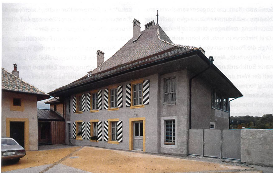
Service des bâtiments, Cure de Gingins, n° 39, 1991

Pfarrhaus von Gingins, 1988–89. Architekt: Jacques Gross