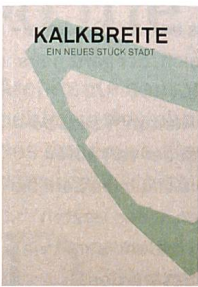
Genossenschaft Kalkbreite (Hg.): Kalkbreite. Ein neues Stück Stadt. Selbstverlag Genossenschaft Kalkbreite, Zürich 2015, 232 S., CHF 35.–

Die Zürcher Genossenschaft Kalkbreite feiert die neue Wohn- und Gewerbeüberbauung sowie sich selbst mit einem ehrlichen Buch. Kurzweilig und vielseitig kommt es im Öko-chic daher und vermittelt neben den Fakten auch Stimmungen und eine Menge aufschlussreicher Erkenntnisse. Denn mit der Eröffnung wurde Erstaunliches erreicht. Die Ausgangslage der Planung zwischen Tramdepot, Zuggleisen und Verkehrsachsen liess traditionelle Investoren die Köpfe schütteln. Wie es trotzdem dazu kam, dass an diesem Ort ein lebendiges «neues Stück Stadt» mit Magnetfunktion entstehen konnte, zeigen die kompakten Beiträge vom Direktor des Amtes für Städtebau bis zu den Initianten des alternativen Thinktanks «Stadtlabor». Hier wurde auch ein «neues Stück» Stadtentwicklungsgeschichte geschrieben. Karthago und Kraftwerk gingen voraus, weitere folgen: «mehr als wohnen» auf dem Hunziker-Areal in Zürich Nord und aktuelle Basler Projekte schlagen ähnliche Wege ein auf der Suche nach einem nutzerbestimmten Wohnen mit mehr Gemeinschaft und flexibleren Lebensmodellen. Françoise Krattinger