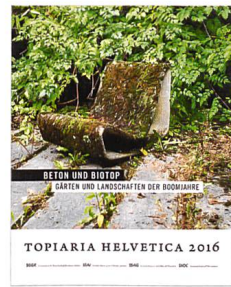
Schweiz. Gesellschaft für Gartenkultur SGGK (Hg.): Beton und Biotop. Gärten und Landschaften der Boomjahre. Topiaria Helvetica Band 2016, vdf Hochschulverlag, Zürich 2016, 112 S., CHF 42.–