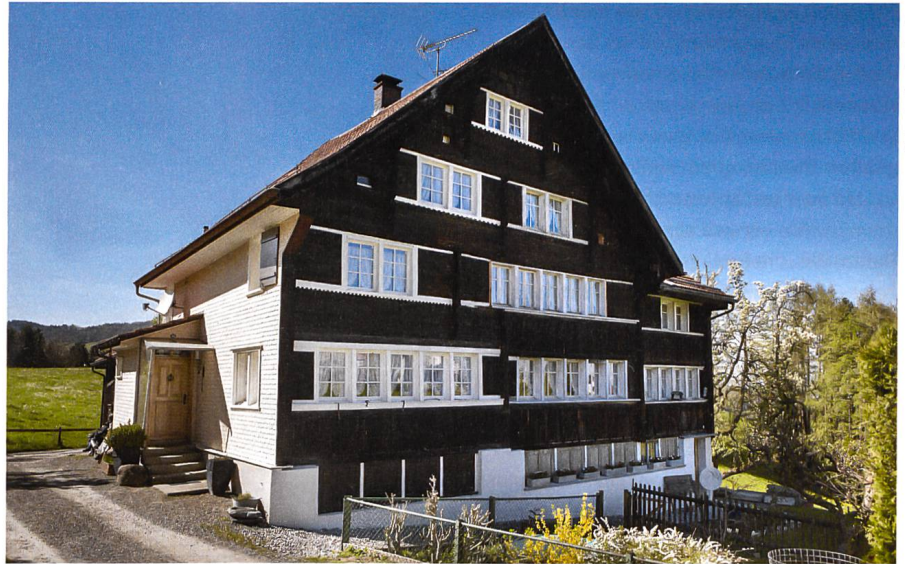
Ferien im Baudenkmal

Mit dem Doppelhaus Vogelherd in Wolfhalden kann die vom Schweizer Heimatschutz ins Leben gerufene Stiftung Ferien im Baudenkmal schon bald ihr Sortiment durch ein Objekt der Appenzeller Baukultur erweitern. Im geschichtsreichen Strickbau, welcher