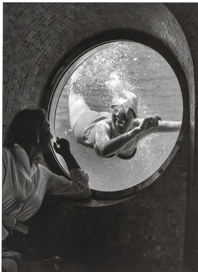
Die Attraktion der Unterwasserbar: der Blick durch eines der drei Bullaugenfenster ins Schwimmbecken.

L'aqua-bar est une véritable attraction grâce à ses trois hublots donnant sur le bassin de natation.