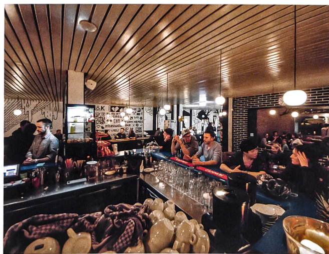
Die mit minimalen Gestaltungsmitteln attraktiver gemachte Hallenbad-Bar Le bar remis au goût du jour après quelques changements minimes