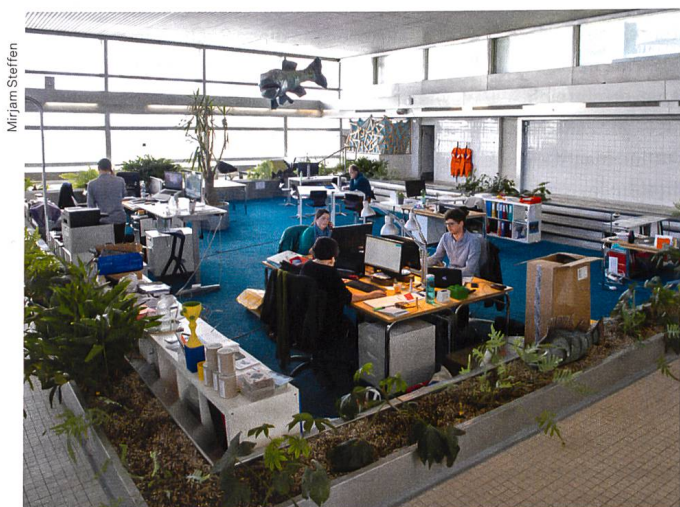
Der Co-Work-Raum im ehemaligen Lernschwimmbecken L'espace de co-working dans l'ancien bassin d'apprentissage de la natation

Construite en 1969, la piscine de Biregg a dû fermer en 2012 pour cause de vétusté. Son avenir est à l'agenda de la ville de Lucerne depuis 20 ans. Depuis l'ouverture d'une nouvelle piscine à l'Allmend, sa démolition semble inéluctable. En 2013, le collectif Neubad qui s'était créé pour transformer ce lieu en centre culturel a obtenu de la municipalité un contrat d'exploitation qui court jusqu'en 2017. Après un investissement de 500 000 francs et 8000 heures de bénévolat dans des travaux, il a ouvert un restaurant, un espace de co-working convivial, des ateliers et une salle de spectacle. «L'année dernière, nous avons réalisé un chiffre d'affaires de 1,9 million de francs et donné du travail à 40 personnes – et sans subventions!», explique Alex Willener. Les places de travail sont accessibles à des petits budgets. La convivialité, l'esprit d'ouverture et la diversité culturelle ont investi les lieux, qui gardent toutefois quelques références à leur affectation d'origine: le tapis bleu marine dans les bureaux ou l'inscription «Douche obligatoire». La piscine carrelée a été transformée en une vaste salle de spectacle très appréciée. L'ensemble du site est devenu une scène culturelle vivante. Aucune planification d'ensemble n'a toutefois été établie. Quand le collectif Neubad devra-t-il partir? Son souhait est de pouvoir compter sur une planification plus précise.