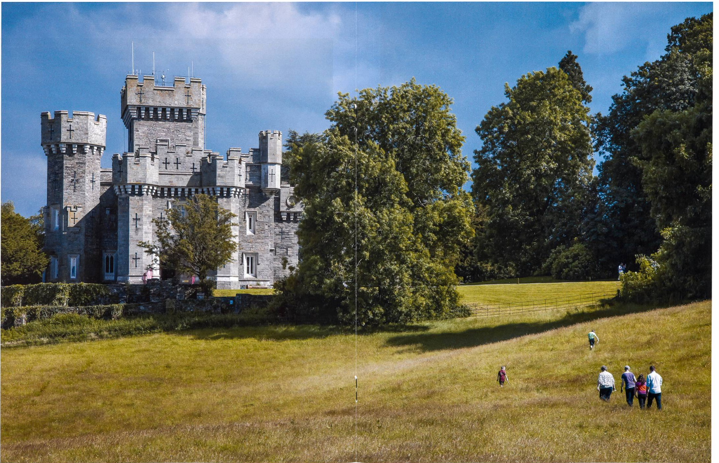
«Wray Castle», dans la région britannique des lacs (Lake District), est une fantastique forteresse de style néogothique édifée en 1840. Das «Wray Castle» im englischen Lake District, ein 1840 im neugotischen Stil erbautes Fantasieschloss