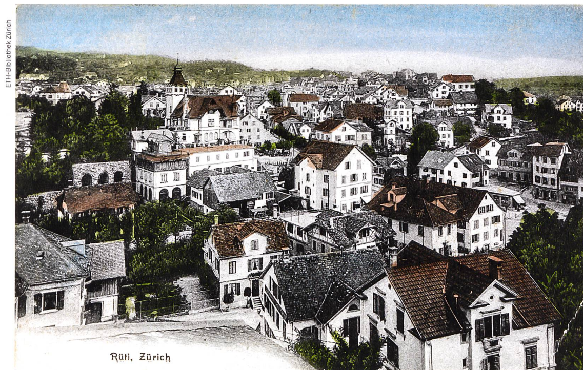
Postkarte von Rüti ZH, vor 1922

Es entbehrt nicht einer gewissen Ironie, dass aktuell starke politische Kräfte das ISOS und den Natur- und Heimatschutz als Ganzes zurückbinden oder gleich abschaffen wollen. Es scheint fast so, als ob das Feld leer geräumt werden müsse, damit sich die Schweiz, die nicht mehr nach aussen wachsen soll, nun nach innen zersiedeln kann. Dass bei diesem politischen Spiel auch nationale und kantonale Planungämter mitmachen, ist mit einer gewissen Erschütterung festzustellen. Sie stehen in der Verantwortung, nicht nur Quantität zu forcieren, sondern für Qualität zu sorgen. So wie es aktuell aussieht, haben einige Ämter und Politiker vergessen, dass man aus der Geschichte auch lernen kann.