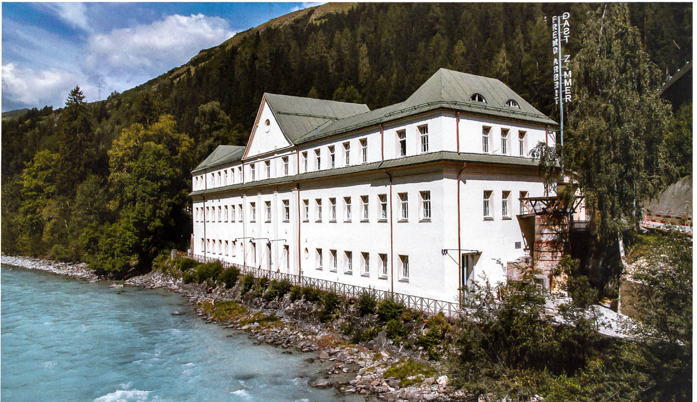
Das frühere Badehaus des Kurhauses Tarasp am Ufer des Inn