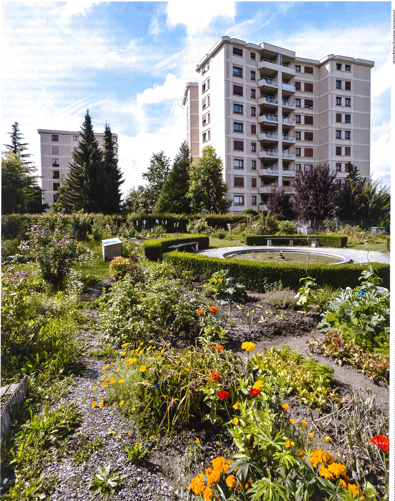
Der Schweizer Heimatschutz würdigte mit dem Schulthess Gartenpreis 2015 die «Plantages», die gemeinsam genutzten Pflanzgärten der Stadt Lausanne VD.