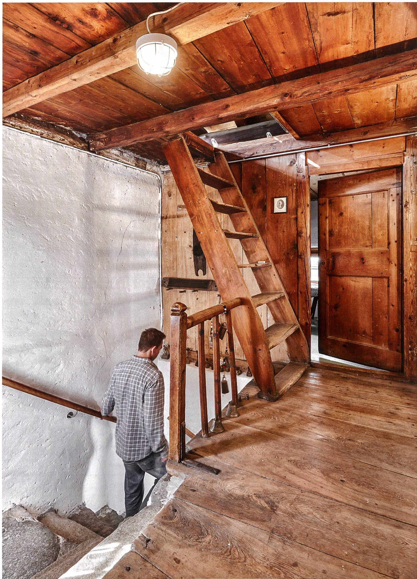
Depuis mars 2015, la Cäsa Picenoni Cief située sur la place du village de Bondo (GR) fait partie de l'offre de la fondation Vacances au cœur du patrimoine créée par Patrimoine suisse.