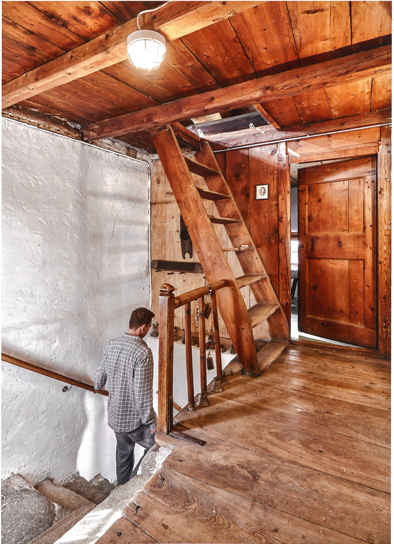
Die Cäsa Piconi Cief am Dorfplatz von Bondo GR steht seit März 2015 im Angebot der vom Schweizer Heimatschutz gegründeten Stiftung Ferien im Baudenkmal.