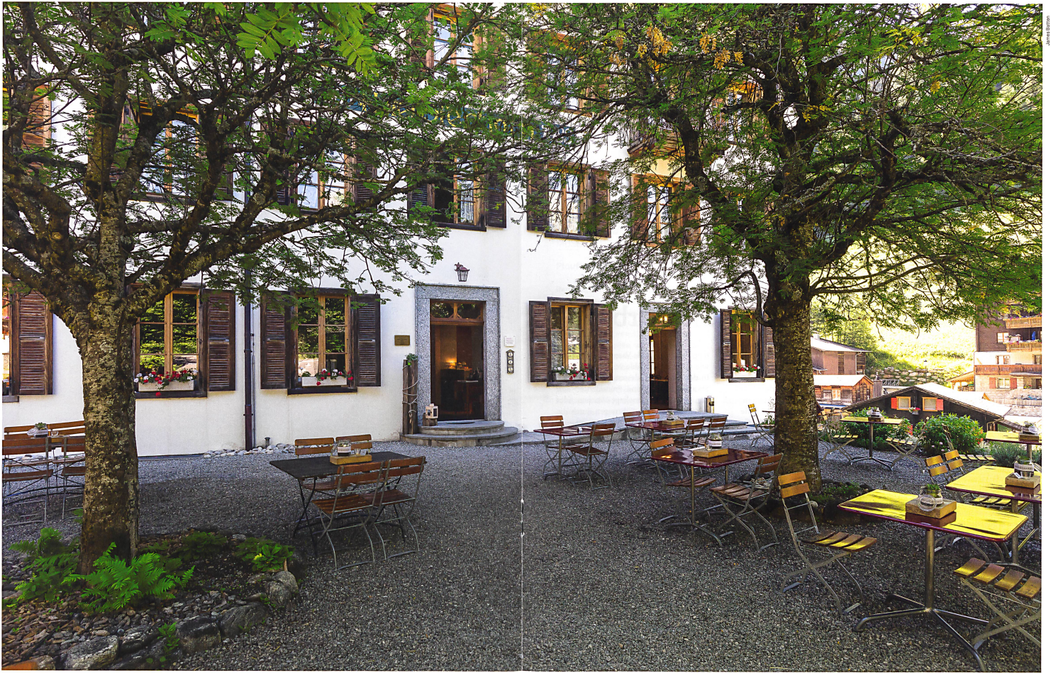
L'hôtel Ofenhorn à Binn: ambiance matinale sous le sorbier de la terrasse-jardin Hotel Ofenhorn in Binn: Vormittagsstimmung unter den Ebereschen des Gastgartens