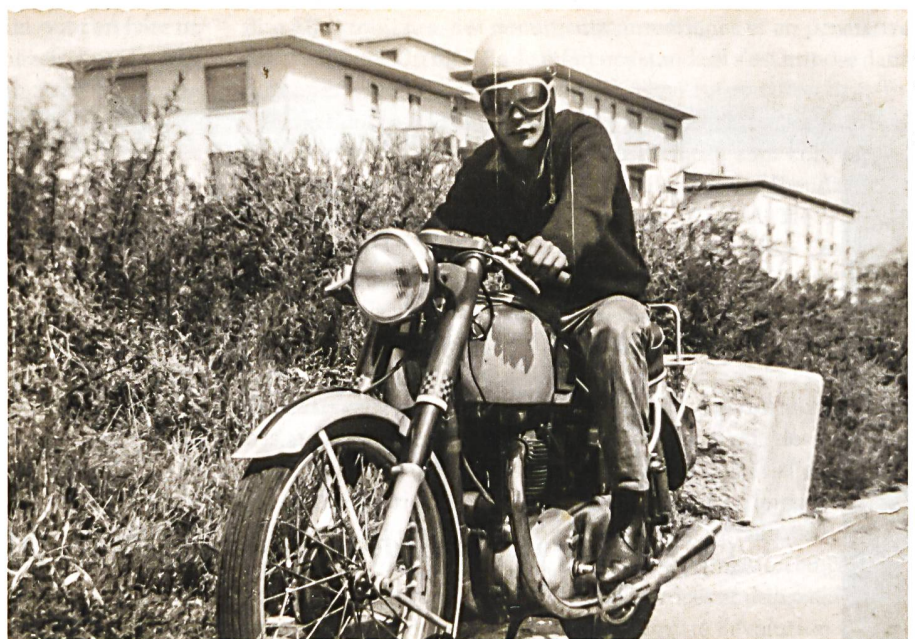
Museum Burg Zug

Das Weiterbildungsangebot EN Bau (Energie und Nachhaltigkeit am Bau) ist eine Kooperation von fünf Hochschulen und bietet eine breite Auswahl an Kursen (CAS) zu den Themen Nachhaltigkeit, Energie, Architektur, Management und Interdisziplinarität im Bauwesen. Nach fünf erfolgreich abgeschlossenen CAS plus einer Masterarbeit erhalten die Studierenden den Master of Advanced Studies in nachhaltigem Bauen. Die Weiterbildung wird unterstützt durch die Energiedirektorenkonferenz, Energie Schweiz und den Schweizerischen Ingenieur- und Architektenverein sia. → www.enbau.ch