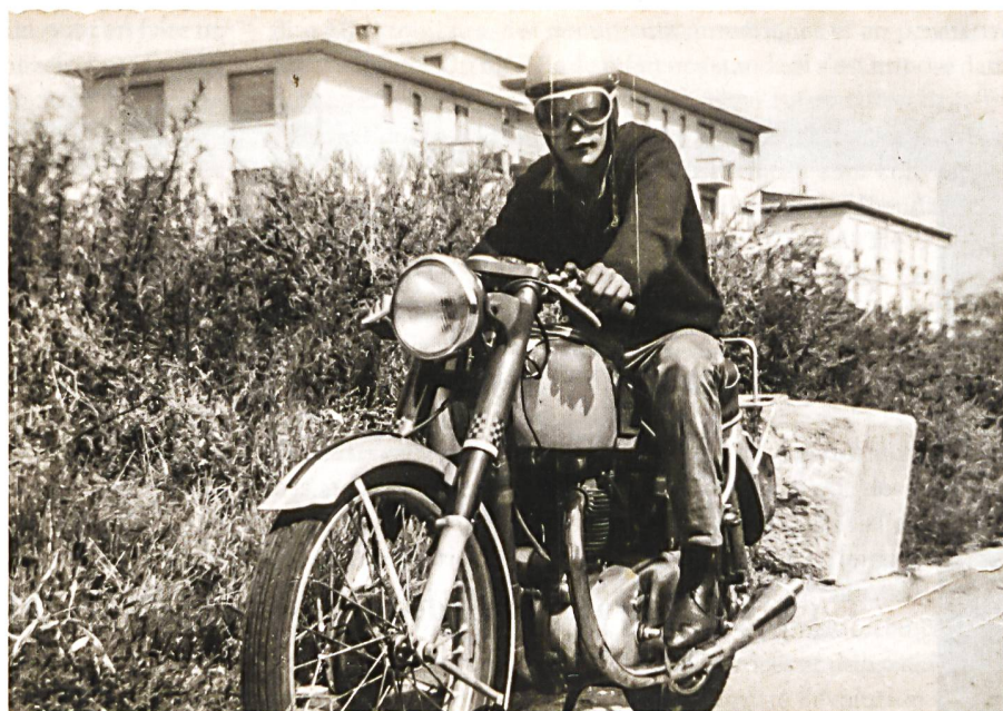
Museum Burg Zug

Das Weiterbildungsangebot EN Bau (Energie und Nachhaltigkeit am Bau) ist eine Kooperation von fünf Hochschulen und bietet eine breite Auswahl an Kursen (CAS) zu den Themen Nachhaltigkeit, Energie, Architektur, Management und Interdisziplinarität im Bauwesen. Nach fünf erfolgreich abgeschlossenen CAS plus einer Masterarbeit erhalten die Studierenden den Master of Advanced Studies in nachhaltigem Bauen. Die Weiterbildung wird unterstützt durch die Energiedirektorenkonferenz, Energie Schweiz und den Schweizerischen Ingenieur- und Architektenverein sia. → www.enbau.ch