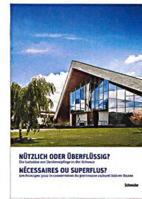
Centre national d'information sur le patrimoine culturel NIKE/BAK/ICOMOS (éd.): Nécessaires ou superflus? Les principes pour la conservation du patrimoine culturel bâti en Suisse. Schwabe, Berne, 2017, 112 p., CHF 33.–

«L'être humain a un besoin fondamental de mémoire.» Cette première phrase des Principes pour la conservation du patrimoine est une expression aussi belle que vraie. Ces principes sont convaincants par la clarté et la précision du langage utilisé pour les définir et par ailleurs parce qu'ils axent la réflexion sur l'importance de l'être humain et de l'ensemble des objets témoignant du passé. Dix ans après la publication de ces principes, le colloque «Nécessaires ou superflus?» organisé à Bâle en novembre 2016 a permis de s'interroger sur leur portée et d'ouvrir la discussion sur les possibilités de contribuer à une unité de doctrine pour tous les acteurs impliqués.