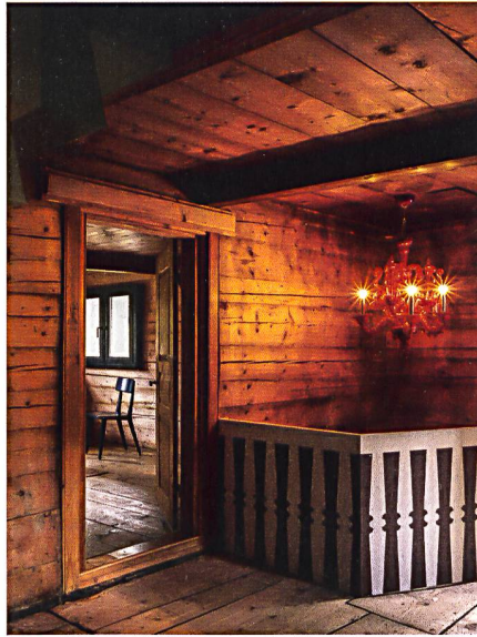
Sichtbarer Strickbau und aufgemaltes Trepengeländer im Obergeschoss

Meubles sur mesure pour les combles peints de rayures vert clair et vert foncé