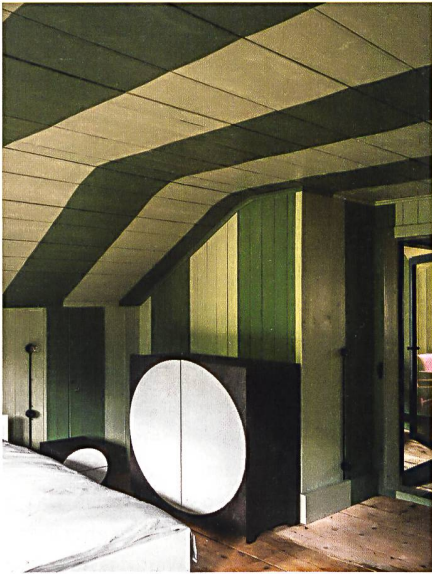
Für das Haus entworfene Möbel im grünen Dachgeschoss

Meubles sur mesure pour les combles peints de rayures vert clair et vert foncé