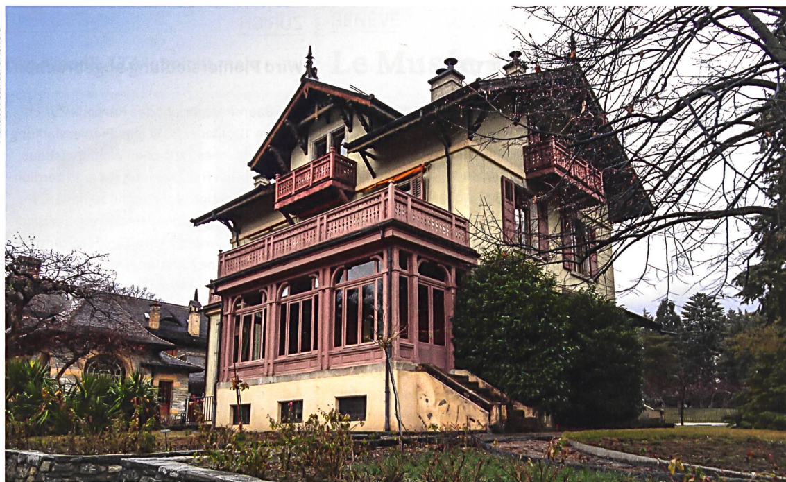
La villa Ruffieux aujourd'hui. Louis Maillard, architecte