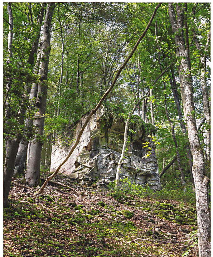
Die Maschinengewehrstellung zur Sicherung der Belchensüdstrasse im Ersten Weltkrieg wurde glücklicherweise nie zu Kampfhandlungen benutzt.

Les vestiges du canal d'Entreroches, près de La Sarraz (VD), sont les témoins d'un projet visionnaire imaginé au XVII e siècle.