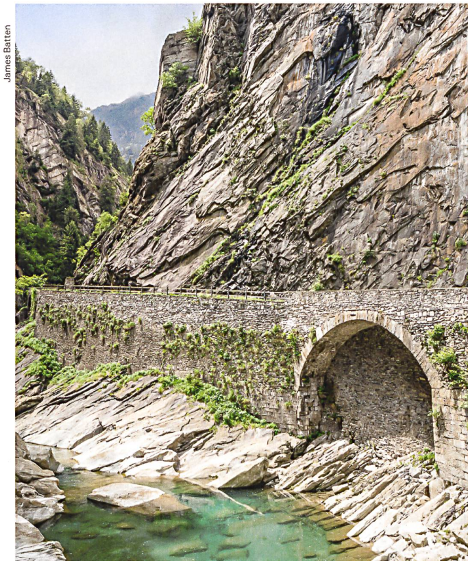
La construction de la «strada commerciale» par les gorges de Piottino fut une réalisation importante du canton du Tessin qui venait d'être créé en 1803.

→ La publication Destination patrimoine – Sentiers historiques est à commander à l'aide du talon-réponse inséré en dernière page de ce numéro ou sur: www.patrimoinesuisse.ch/shop . Prix: 28 francs (membres de Patrimoine suisse: 18 francs)