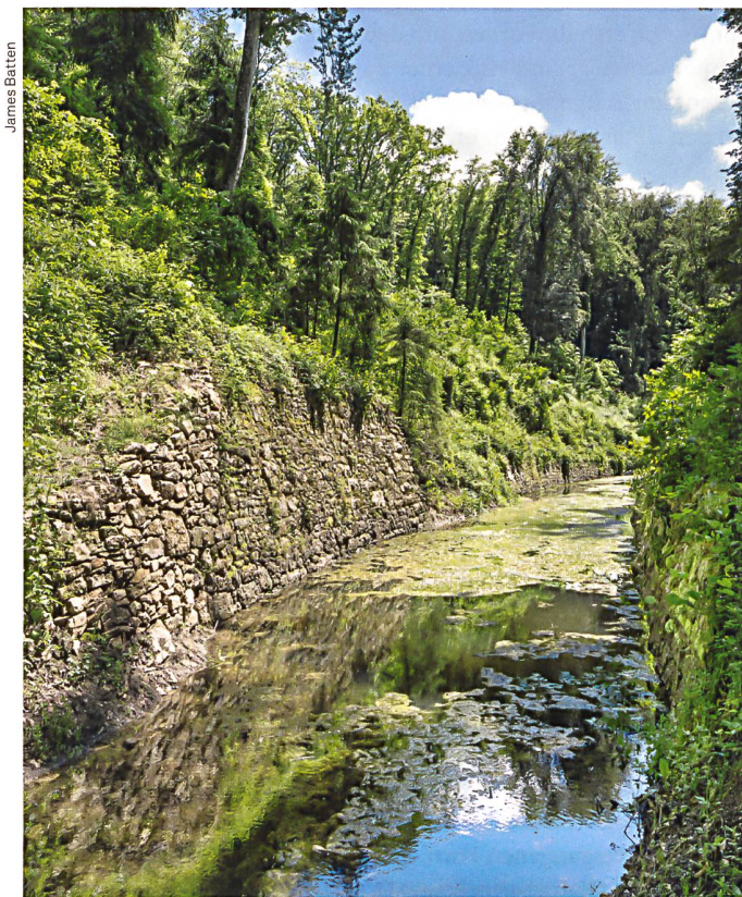
Ein Reststück des Canal d'Entreroches in der Nähe von La Sarraz VD erinnert an ein visionäres Bauvorhaben aus dem 17. Jahrhundert.

→ Die Publikation Heimatschutz unterwegs – Historische Pfade kann mit der Bestellkarte auf der Hefrückseite oder unter www.heimatschutz.ch/shop bestellt werden. Preis: CHF 28.– (Heimatschutzmitglieder: CHF 18.–)