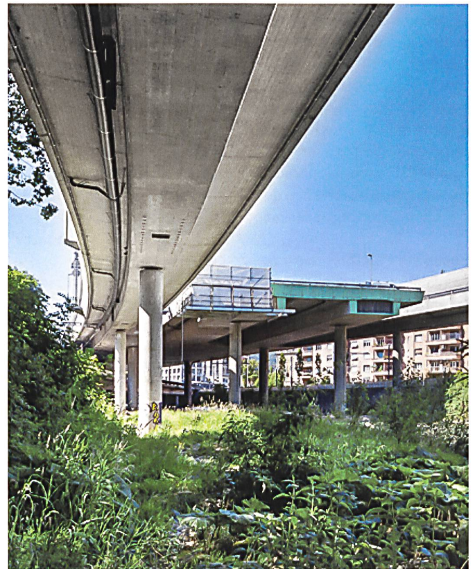
Le moignon de voie express au-dessus de la Sihl à Zurich-Wiedikon est le résultat d'une divergence de points de vue.

Der Bau der «Strada commerciale» durch die Piottinoschlucht war ein wichtiges Vorhaben des erst 1803 gegründeten Kantons Tessin.