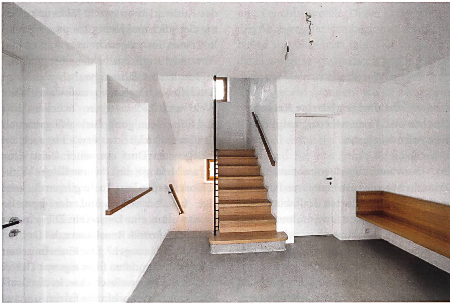
Le hall d'entrée de la mairie. L'escalier a été refait en béton en maintenant les dimensions d'origine.

Die Treppe im Eingangsbereich des Gemeindehauses wurde neu in Beton ausgeführt. Die Originalabmessungen wurden beibehalten.