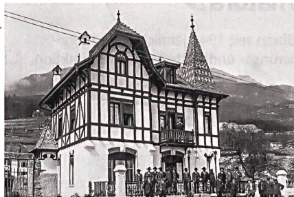
Association du Vieux-Monthey

Le propriétaire du Buffet de la gare AOMC souhaite remplacer cette bâtisse construite au début du XX e siècle par un immeuble comprenant logements, commerces et un parking souterrain. Pourtant, ce bâtiment constitue un important témoin de l'époque ferroviaire et de l'ancienne gare de Monthey. Le Buffet se situe dans le «vieux bourg» et figure dans l'ISOS, l'inventaire fédéral des sites construits d'importance nationale à protéger en Suisse. L'association du Vieux-Monthey s'oppose fermement à la démolition de cet édifice et au projet du propriétaire, tous deux critiqués par la section Patrimoine suisse Valais romand. L'état des démarches est pour l'instant stationnaire.