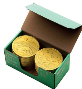
30er-Packungen à CHF 150.– Paquets de 30 écus à CHF 150.–