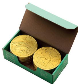
20er-Packungen à CHF 100.– Paquets de 20 écus à CHF 100.–