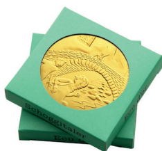
3er-Packungen à CHF 15.– Paquets de 3 écus à CHF 15.–

→ A commander à l'aide de la carte-réponse préaffranchie en dernière page de ce numéro