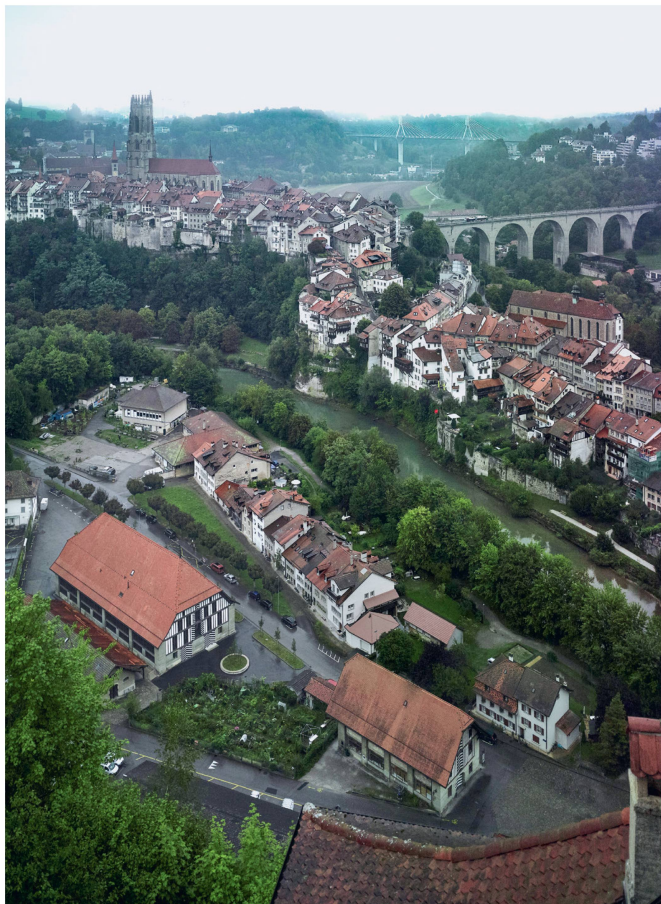
La ville de Fribourg vue aujourd'hui depuis les hauteurs méridionales. Au premier plan à gauche, le grand Werkhof.

La tâche était hors norme et comportait plusieurs angles d'approche. Les architectes se donnèrent pour objectif de sauvegarder au maximum le peu de substance d'origine du Werkhof et de rendre lisible les agrandissements successifs de l'édifice. Un deuxième aspect du projet consistait à reconstruire les façades en se basant notamment sur la représentation de l'édifice dans le plan Martini. La partie principale du projet était cependant d'insérer dans le vaste volume une nouvelle structure autonome adaptée au nouveau programme socio-culturel. Pour nourrir ce troisième volet du projet, lui insuffler de la vie, les architectes se sont