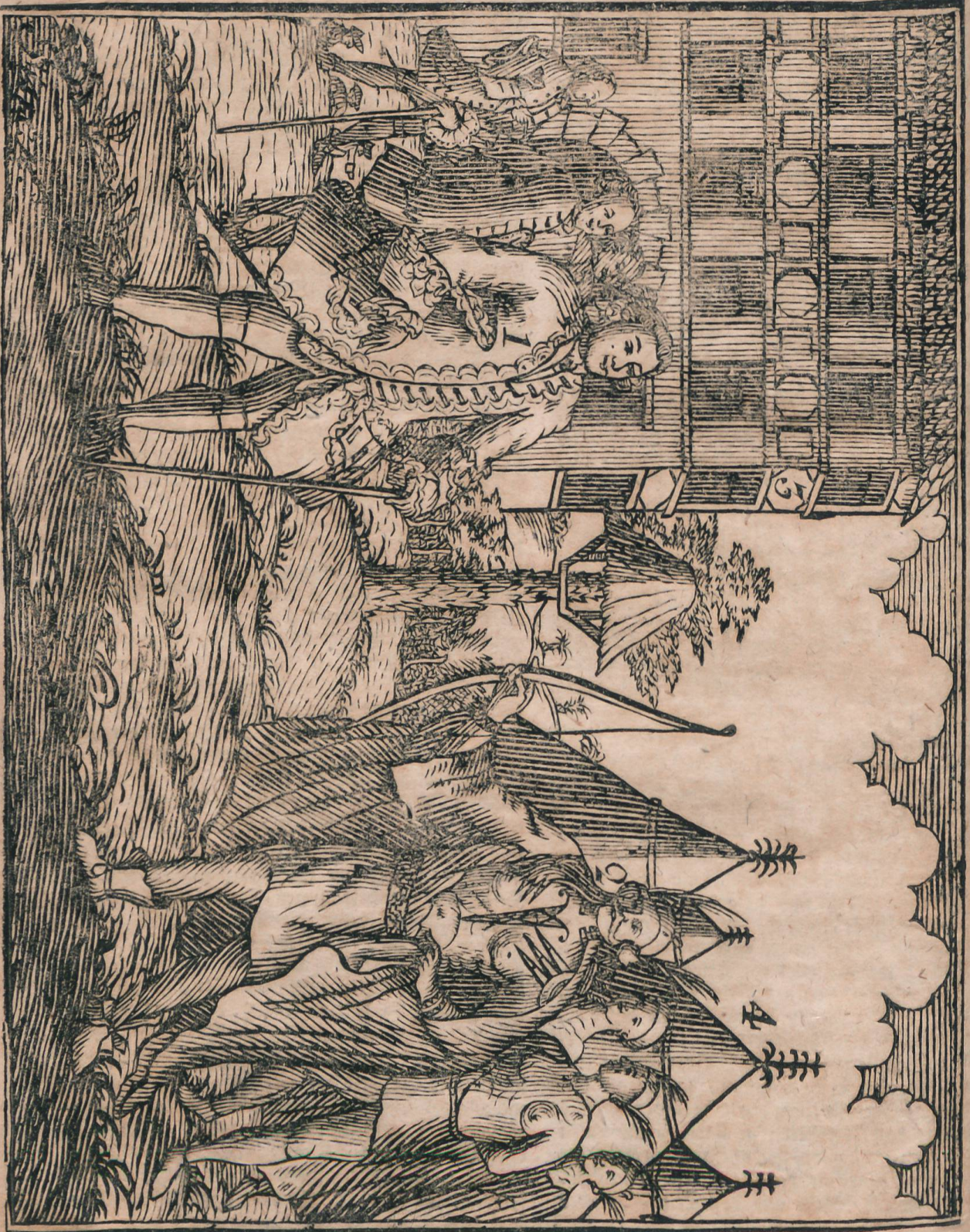
Zwischen Engländern und Indianern in North-Carolina, den 20. Aprilmonat 1719.

ten hat wider rolina wofen mein wird Du, wesen König Herz seiner sit si haben tet wo nur li schiffe des gr kungs unter haben Meer sch, und t du ni du w schaff diese Zu den l das i foder entse das thun ich e theu umf Sch nug lung diese tig g Ma nich 1. Bes 2 3 4