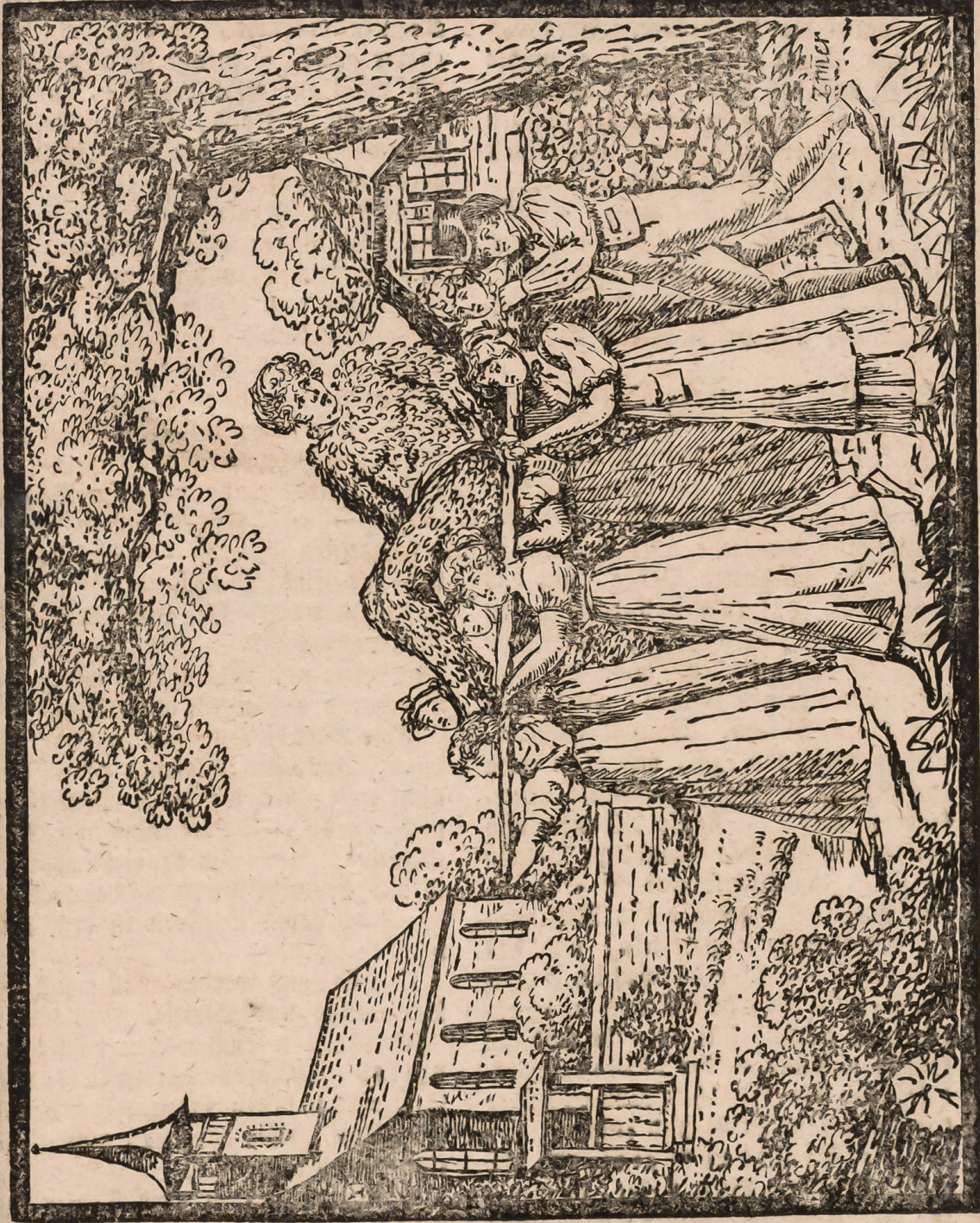
Die betrubte Pochzeit.

n! n: er- ng ge- or- je. al- ge- les als ne an st; em el- nd ng la- ar jet - ne nd hu nd es er t,