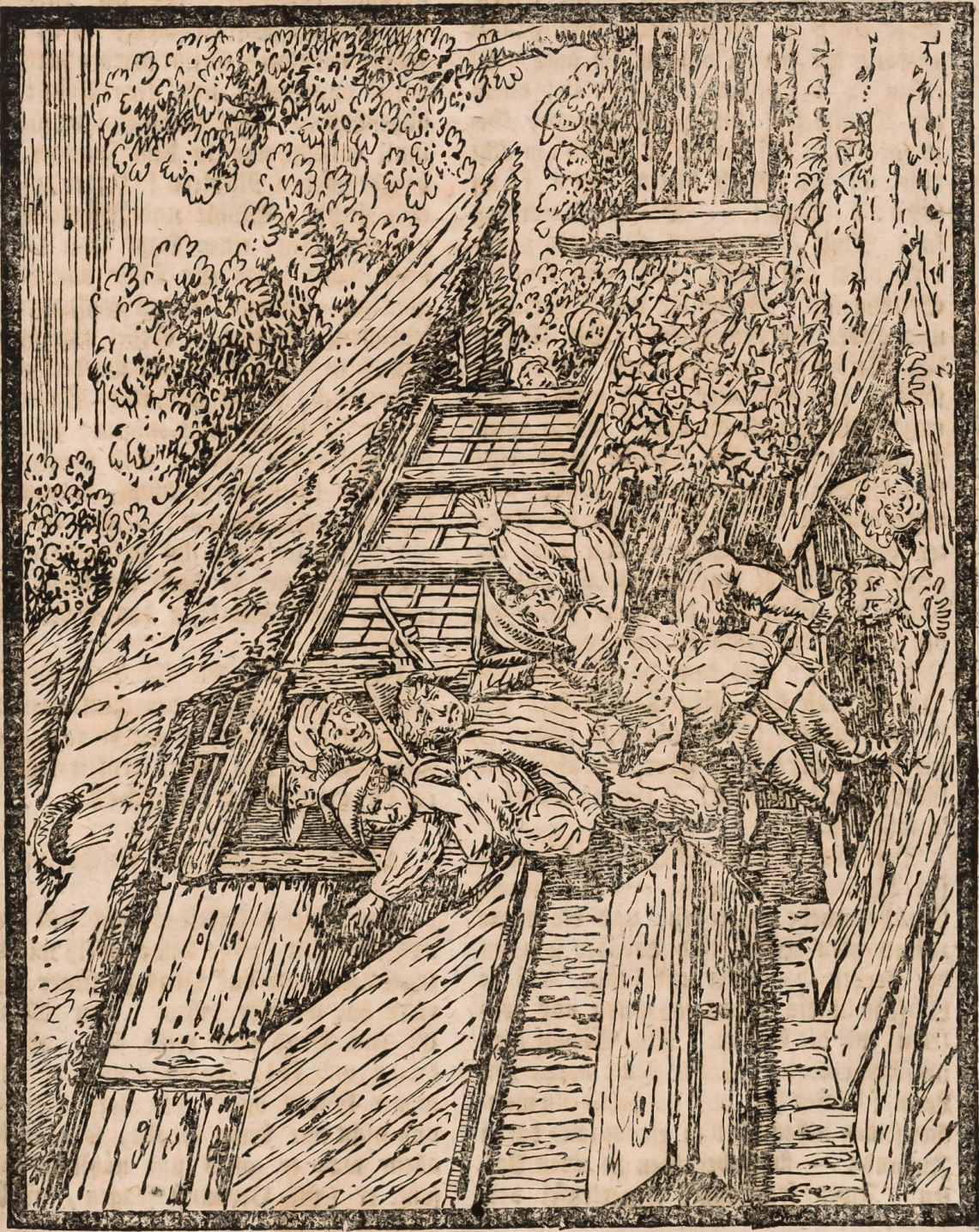
Die neu-modische Maufefalle.