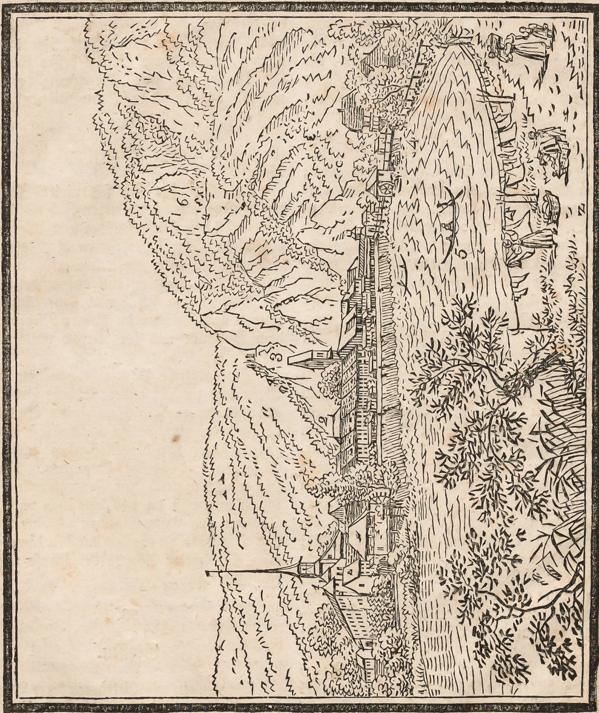
1. Schloß. 2. Städtchen. 3. Kirche. 4. Alboffang. 5. Mar. 6. Harder.