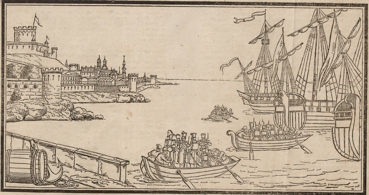
Die Franzosen vor Ancona.