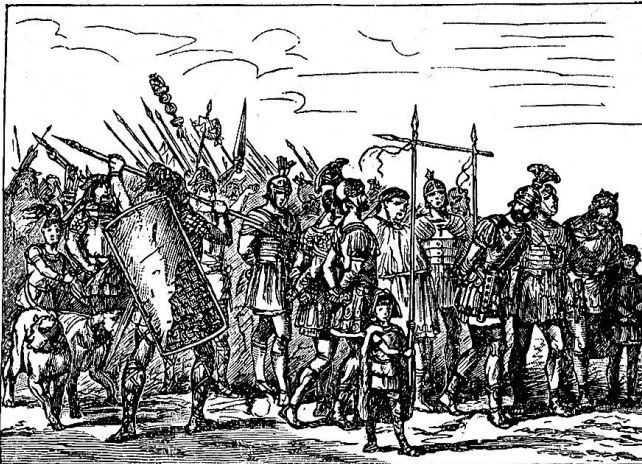
Helveter und gefangene Römer.

müthigen, langgezogenen Tönen stimmte auch der Anblick der gehörnten, mit Fellen bekleideten Pfahlbauern, die den Zug eröffneten. Kraftvolle Gestalten vertraten dieses Urvolk, von dem uns die in den Schweizerseen gefundenen Ueberreste ziemlich genaue Kunde geben. Die Pfahlhütte auf dem Wagen und der nachfolgende von drei indianerhaften Gestalten geruderte Einbaum waren außerordentlich gelungen. Es folgten die alten Helveter unter Diviko, schon etwas zivilisierter aussehend und hinter sich gefangene Römer herführend, die zur Schmach unter dem Speergalgen durchziehen müssen. Sodann kam eine der prachtvollsten Gruppen des ganzen Zuges, Herzog Berchtold von Zähringen mit Gemahlin