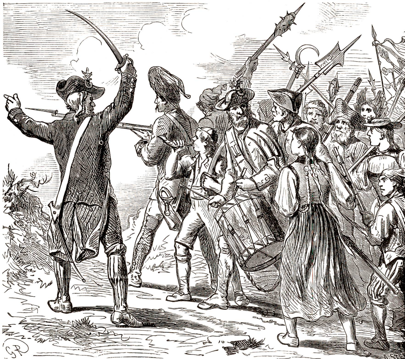
Der Landsturm im Grauholz.

unwillkürlicher Ehrfurcht und Staunen ob seiner Größe. Wortlos schritt er von dannen; er ging, wohin ihn Pflicht und Ehre riefen. So nahm der letzte Amtsschultheiß des alten Bern Abschied.