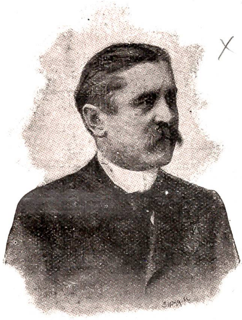
Alt-Bundesrat Numa Droz.