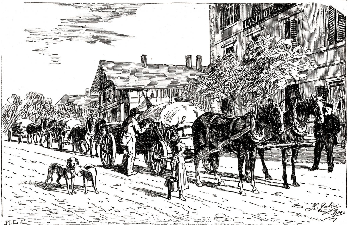
Im Spätherbst sieht man denn auch auf den Landstraßen regelmäßig solche „Käsfuhren“.

deuten für diejenigen, welche damit betraut werden, allemal einen vergnügten Tag, und es kommt nicht selten vor, daß auf dem Rückweg der Wagen wohl leer, der Mann dafür aber um so geladener ist.