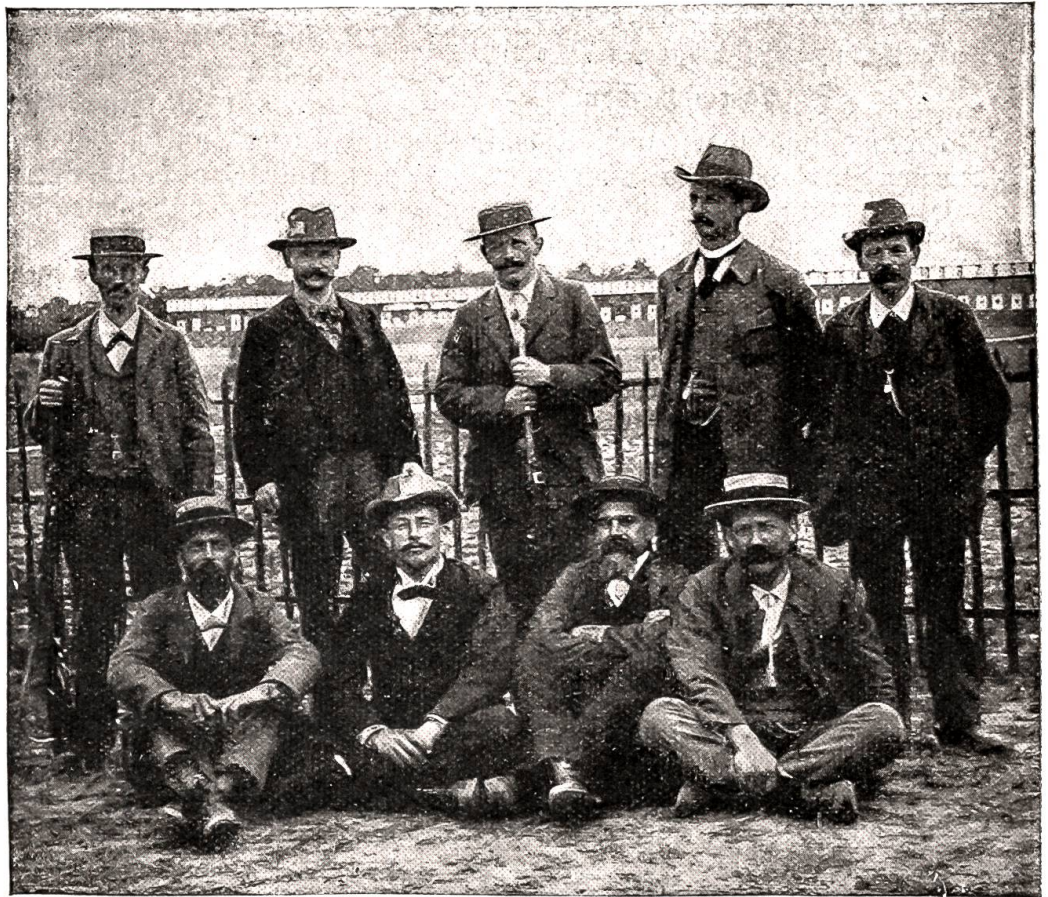
Unsere Meisterschützen in Paris.