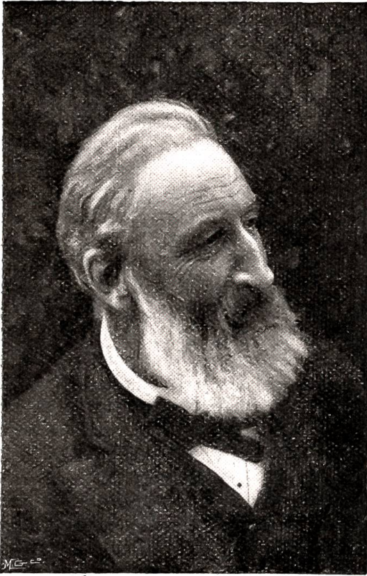
Oberst Rudolf von Sinner.

internationalen Gewehrmatches auf 300 Meter ist folgendes: An erster Linie steht die Schweiz mit 4399 Punkten (Schützen: Bökli, Kellenberger, Stäheli, Grütter und Richardet). Dann folgen: 2. Norwegen mit 4290, 3. Frankreich mit 4278, 4. Dänemark mit 4255, 5. Holland mit 4221 und 6. Belgien mit 4166 Punkten. Das beste Gesamtergebnis erreichte Kellenberger (Schweiz) mit 930 Punkten. Im Stehendsschießen war Erster Madison (Dänemark) mit 305, im Knieendsschießen Stäheli (Schweiz) mit 324 und im Liegendsschießen Paroche (Frankreich) mit 332 Punkten. Der beim internationalen Revolver-Wettsschießen in Paris als Meisterschütze der Welt proklamierte Konrad Rüdeler in St. Gallen ist aus Trogen gebürtig, und der beim internationalen Gewehr-Wettsschießen ebenfalls als Meisterschütze der Welt proklamierte Emil Kellenberger ist Bürger von Walzenhausen.