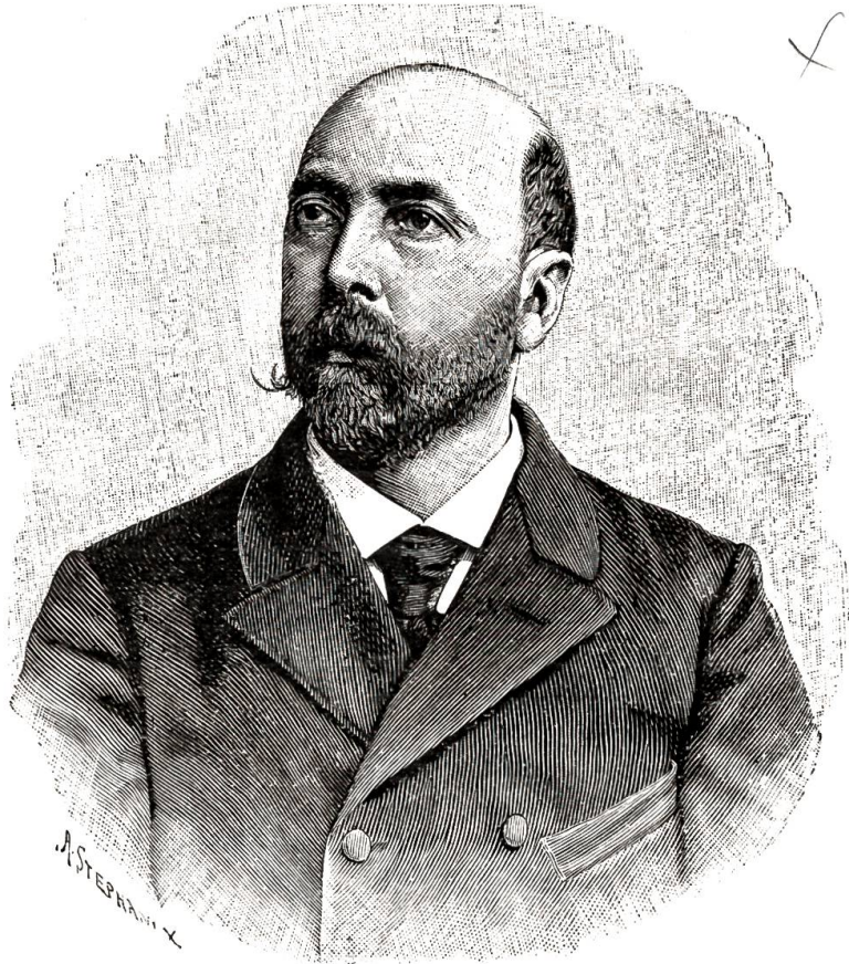
Ernst Brenner, Bundespräsident pro 1901.

Januar. Zur Feier der Jahrhundertwende und zugleich als Probe für die Beleuchtungsanlage wurde am Sylvesterabend der Innenraum der Kuppel des neuen Parlamentsgebäudes zum erstenmal elektrisch beleuchtet. — Ankunft des „ersten Bundesbahnzuges“ von Marau am Neujahrsmorgen um 2 Uhr im Berner Bahnhof. — Die berühmte