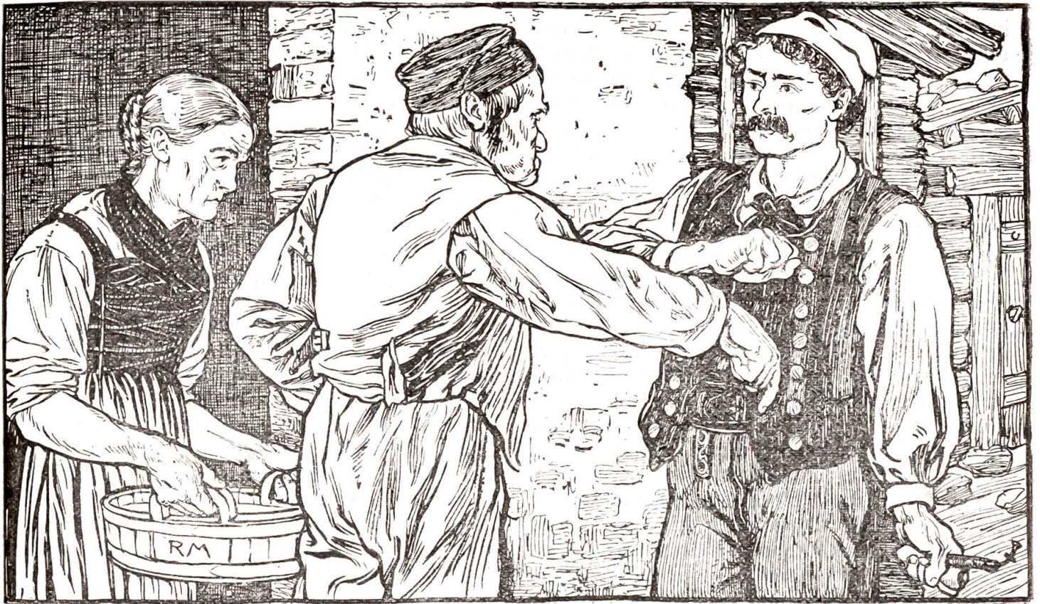
Das verdroß den Alten, er rief: „Du nimmst sie nicht, die Dudel!“

blieb daheim, aber er schlief nicht, sondern wachte die ganze Nacht und sann und überlegte, was da zu machen war. Sauber und fein ist sie freilich; der Narr, er hätte sich's damit genug sein lassen sollen. Aber heiraten!