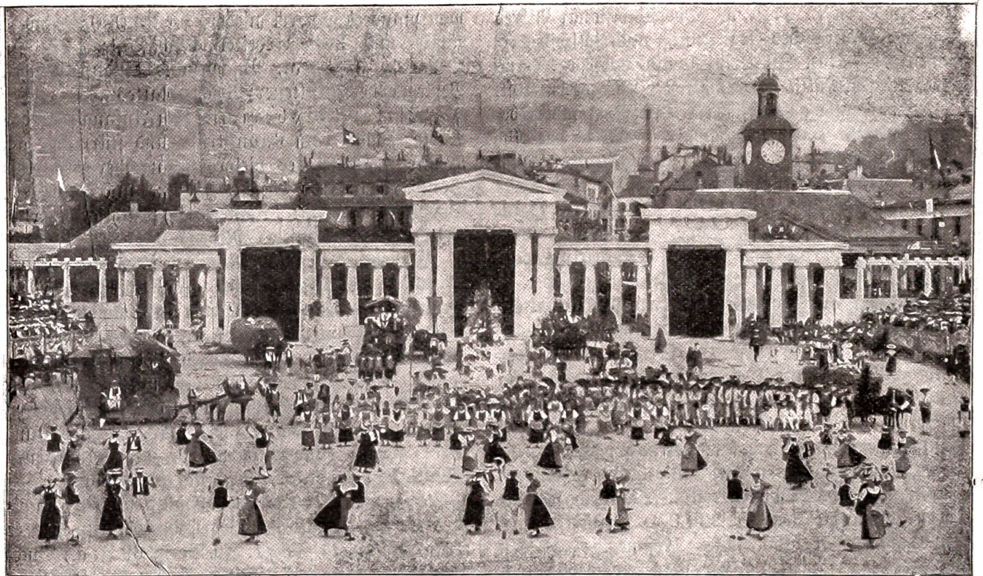
Herbstballett der Winzer am Winzerfest in Bibis, August 1905.