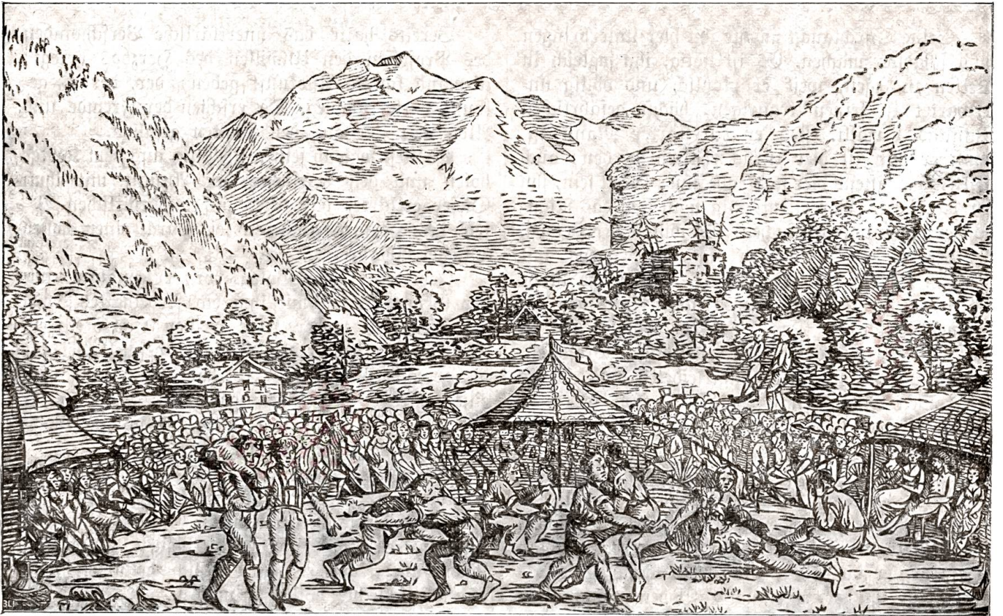
Hirtensfest in Unspunnen 1805. (Nach dem Original im „Sinkenden Bot“ von 1805.)

Jahrhundert seines Bestehens als Fremdenort zu feiern, dem Schwingfest einen größern historischen Rahmen zu verleihen, an das erste Fest der schweizerischen Alpenhirten anzuknüpfen.