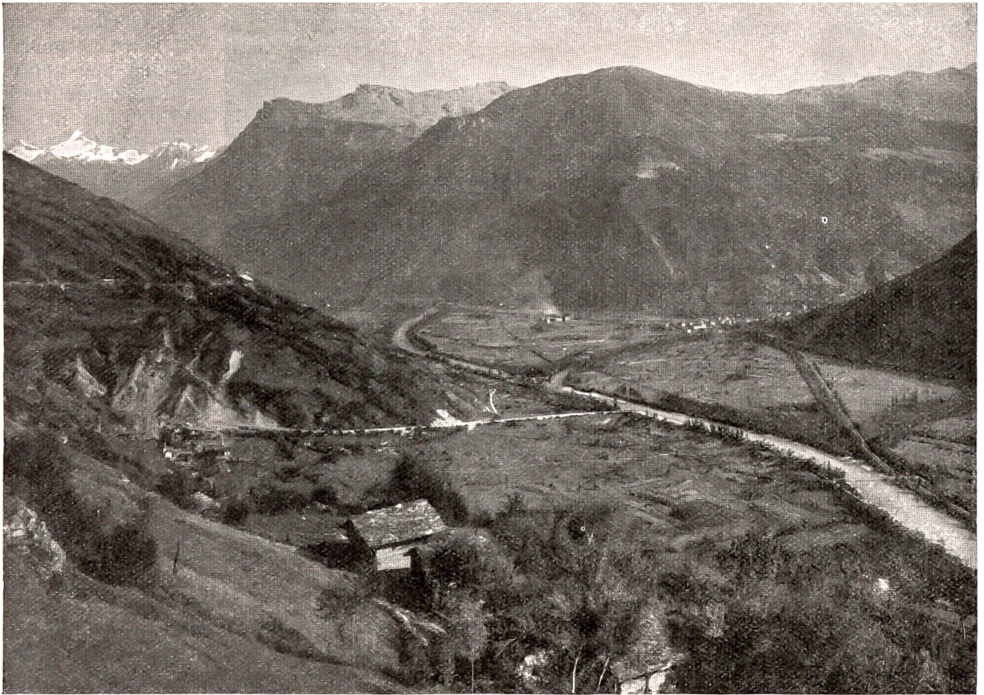
Blick von der Bahnlinie bei Außerberg aus auf Baltfchieder und Bisp im Rhonetal.

Die Berner Alpenbahn umfaßt die Bahnlinien Thun-Spiez-Frutigen-Kandersteg-Brig und Spiez-Interlaken-Bönigen. Sie besitzt auch die Dampfschiffe auf dem Thuner- und Brienersee. In ihrem Betriebe befinden sich sodann die Linien von Bern nach Schwarzenburg, die Gürbetalbahn von Bern über Belp nach Thun und die Simmentallinie von Spiez nach Zweisimmen.