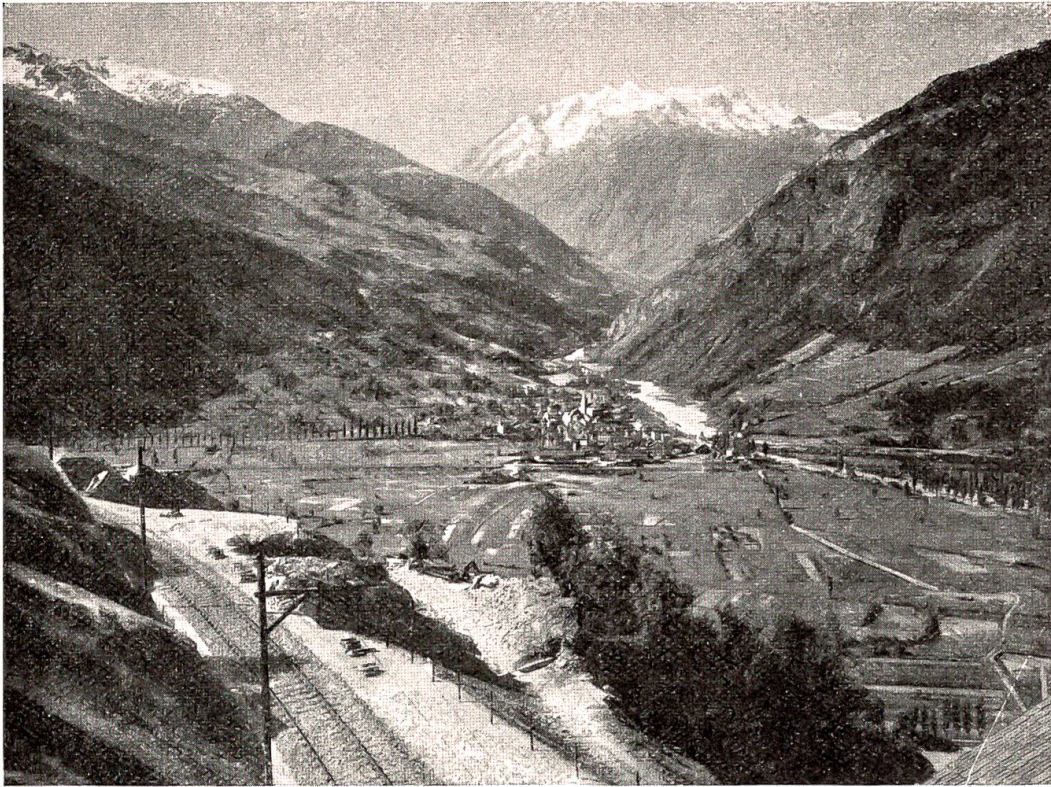
Blick auf Visp und die Mischabelgruppe von Eggerberg aus.

wenige, noch fast völlig unberührt war vom Fremdenverkehr. Das Tal hatte bisher noch keine Fahrstraße, nur ein schmaler Saumweg führt von Goppenstein hinauf. Neben dem Tunneleingang steht der sagenumwobene Felsfloh des „Anfenkübeli“. Auf dem hübschen Weg gelangt man schon in einer halben Stunde auf die Höhe von Feiden, dem ersten Dorf im Tal, und in einer weitem Viertelstunde schon ist man im Dorfe selbst. Dies ist ein ungemein charakteristisches Vötschentaldörfchen. Die Häuser, schwarzbraun von der Sonne gebrannt, scharen sich um ein weißes Kapellchen. In prächtigem Alpengarten reiht sich Weiler an Weiler. Niemand wird's gereuen, diesem originellsten Alpentale einen Besuch abgestattet zu haben. Es ist nur zu befürchten, daß uniere Kultur mit Straßen, Hotels und anderem das Tal verunzieren werde. Der Anfang ist leider jetzt schon gemacht. — Wenig unter Goppenstein, bei Gothen, tritt die Bahn ins Rhonetal ein, 440 Meter hoch über der Talsohle. Es bietet