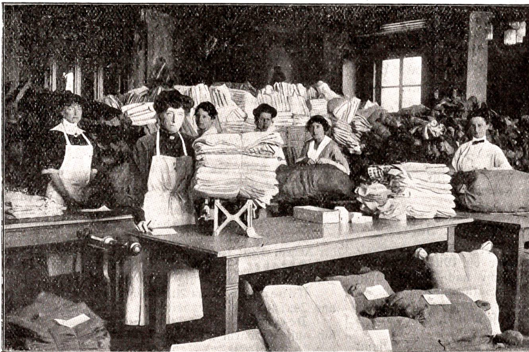
Das „Rote Kreuz“ an der Arbeit

Eine riesige Aufgabe erwuchs der Schweiz durch die Unterstützung und die Heimshaffung der internierten Zivilpersonen, der Flüchtlinge aus dem Elsaß, der Kriegsgeiseln, der heimatlos gewordenen