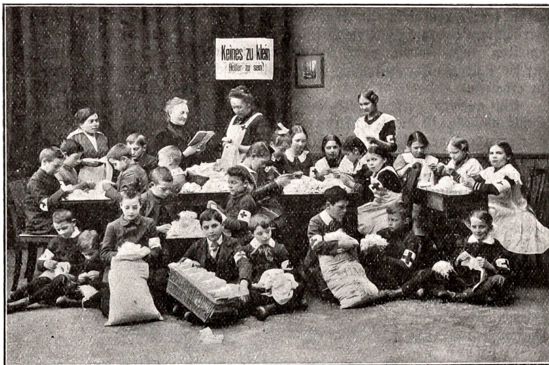
Scharptezupfen für die Verwundeten.

Ein überaus wohl-tätig wirkender Ver- ein, dessen Tätigkeit jedem einzelnen direkt zugute kommt, ist die Kri eg s w ä s c h e r e i. Unbemittelten, ein- zelnstehenden Solda- ten, die niemand haben, der sich ihrer annimmt, wird un- entgeltlich gewaschen, so oft sie ihre Wäsche schicken. Die durch- löcherten Hemden und Strümpfe werden sorgfältigst geflickt und ganz Schadhafte durch Neues ersetzt; diese Soldaten säckli, die von der Post gratis spediert werden, bilden oft einen Kanal, durch den ungehindert Liebes- gaben in den ver- schiedensten Formen den Wackern zu- fließen. Von Anfang Januar bis Ende Mai wurden 8603 solcher Säckli spediert mit 48,161 Stück Wäsche. Diese Riesen-