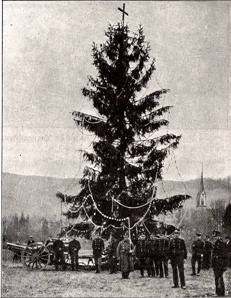
Weihnachtsfeier des 1. Regiments in Rükelflüh.

man kein Ende vor sich! Wer hätte beim Versenden der Weihnachtsgaben gedacht, daß auch auf Ostern wieder so viele Liebesgaben ins Feld gesandt würden? Wer hätte an Ostern gedacht, welch furchtbares Pfingstgeschenk Italien der armen, gefolterten Menschheit bescheren würde, und wer weiß, ob nicht auch im Winter 1915 abermals Weihnachten unter den Waffen gefeiert wird?