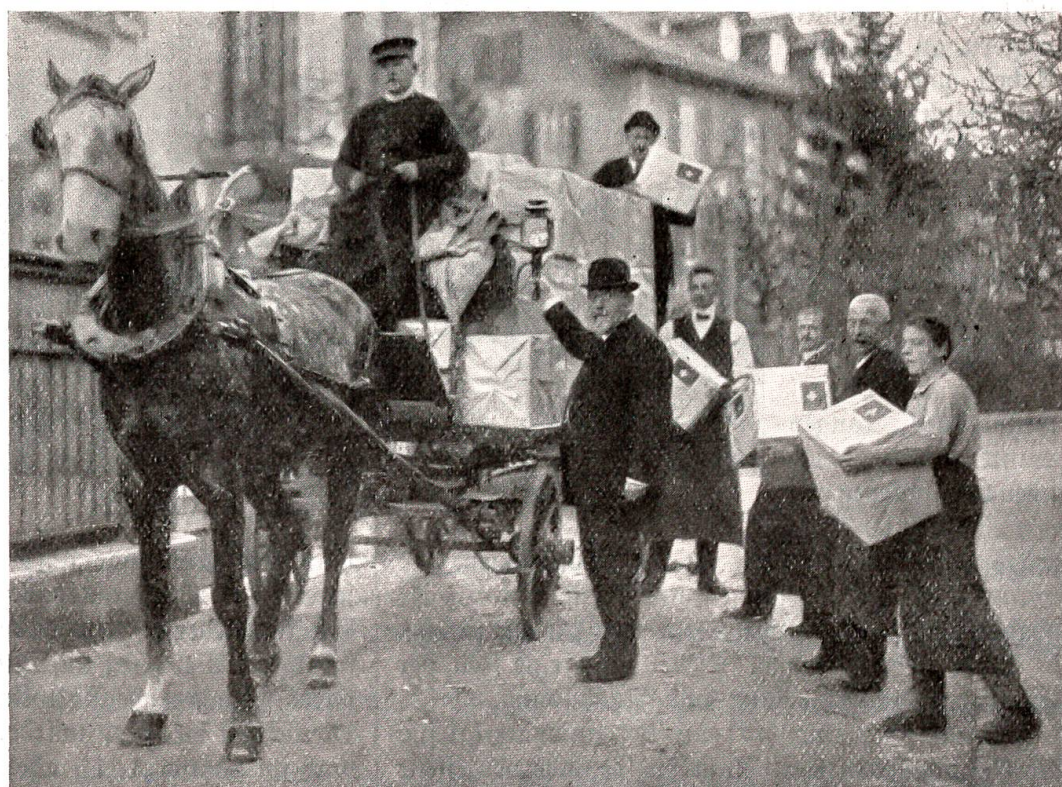
Die Pakete mit den Weihnachtspäckli werden zur Post gebracht.