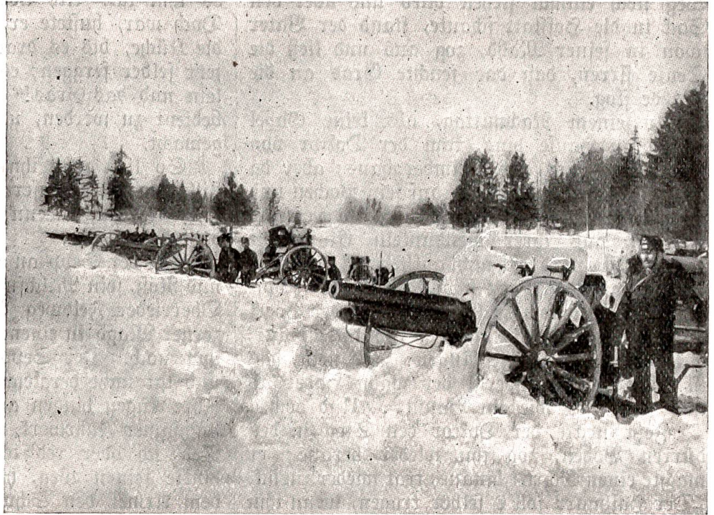
Schießübungen einer Feldbatterie in den Zurbärgen.

In Sepplis Augen leuchtete etwas auf, er machte einen Schritt nach der Fenntür, als ob er dem Vater ein Wort noch sagen möchte; aber wie der alte Mann in der Richtung mit der ausgestreckten Hand nach dem Wege wies, der vom Haus hinaus und in die Straße führte, kehrt' er sich um, wie einer, den des Alten Wort und Wink gezwungen. In einer Hast, als ob er eine veräumte Frist einbringen müßte, holte Seppli seine Ausrüstung herab. Als der Alte aus dem Stalle kam, stand der Soldat am Fenster und blickte durch den Gewehrlauf. Er sah dem Alten entgegen, als