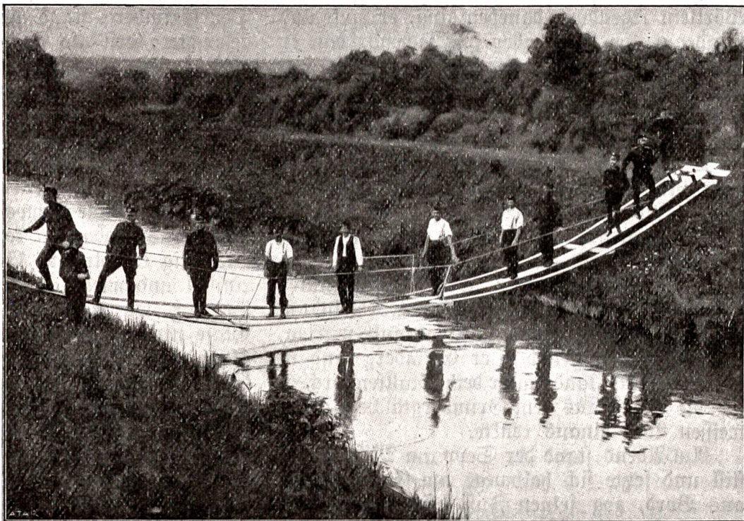
Herstellung einer fliegenden Brücke.

An einem Tage ist ein Brief in den Grim-berg getragen worden. Der Grimberg hat fast den ganzen Nachmittag, bis er ihn gelesen. Da steht darin, daß der Bub im Lazarett liegt; er hat sich in einer Nacht beim Patrouillengehen übel gewirset und liegt jetzt lahm zu Bett.