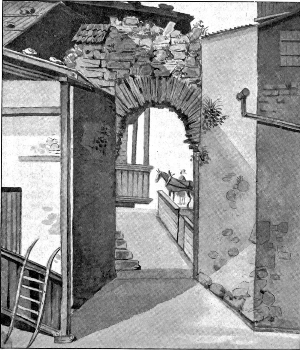
Das alte Stadttor in Spiez.

Nach einem Aquarell von Pfarrer Karl Howald, um 1850.