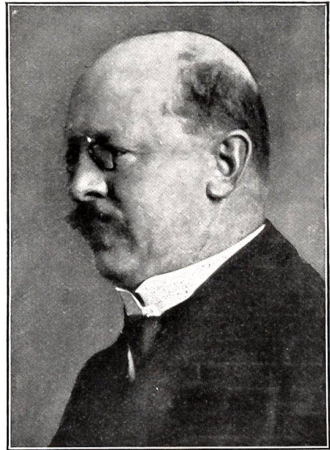
Bundesrat Karl Scheurer, † 14. November 1929.