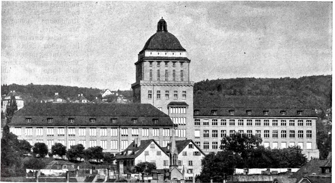
Die neue Universität in Zürich.