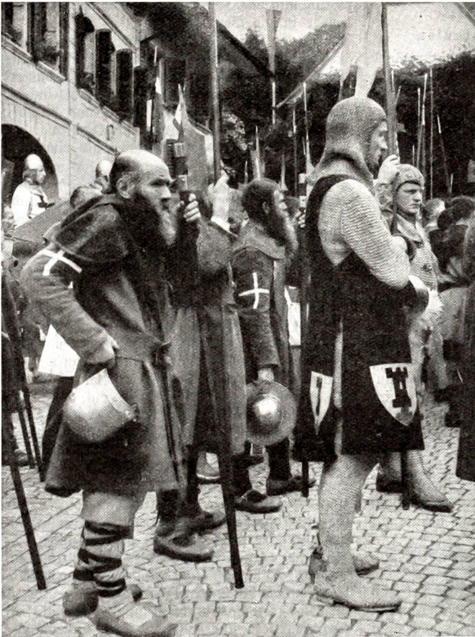
Männer von Hasli und Niedersimmental im Städtchen Laupen, Juni 1939.