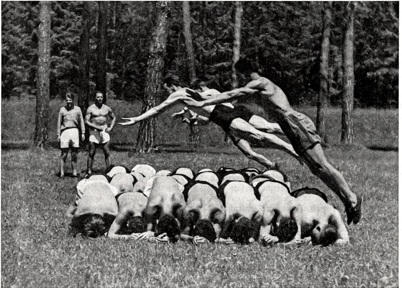
Schulung zum Nahkampf. Hechtsprung. Z. Nr. Gr. III/2952. — Produktion Schweizer Armeefilmdienst.

„Allmächtiger — so hab' ich heute nacht auch gerufen, als ich von einem Schrecken in den andern fiel“, erwiderte Herr Färber mit Mär-