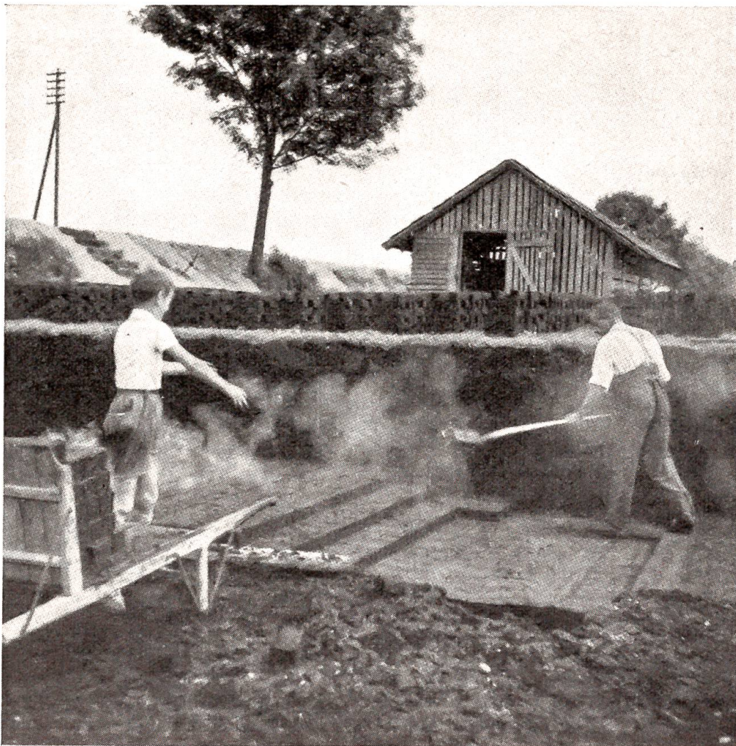
Torfstich im Moos bei Moosseedorf.

der Angriff Rommels jedoch zum Stehen. Nach verschiedenen Angriffen und Gegenangriffen von mehr lokaler Bedeutung setzte Rommel Anfang September erneut zur Offensive an. Aber die inzwischen verstärkte britische 8. Armee, die kurz vorher in General W. Montgomery einen neuen Kommandanten erhalten hatte, hielt stand. Feldmarschall Rommel flog hierauf nach Berlin, vermutlich um bei Hitler persönlich Verstärkungen und Material anzufordern. Aber noch bevor er erneut zum Angriff schritt, eröffnete am 24. Oktober Montgomery eine Offensive. Schwere Flugangriffe auf den Hafen von Genua, auf Turin, Mailand und andere für den deutsch-italienischen Nachschub wichtige Punkte waren unmittelbar vorausgegangen. Trotz einem Gegen-