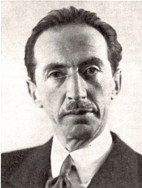
Enrico Celio, Bundespräsident für das Jahr 1943.

Die gewaltigen Kriegsanstrengungen besonders auch der Alliierten, die sich in solchen Zahlen