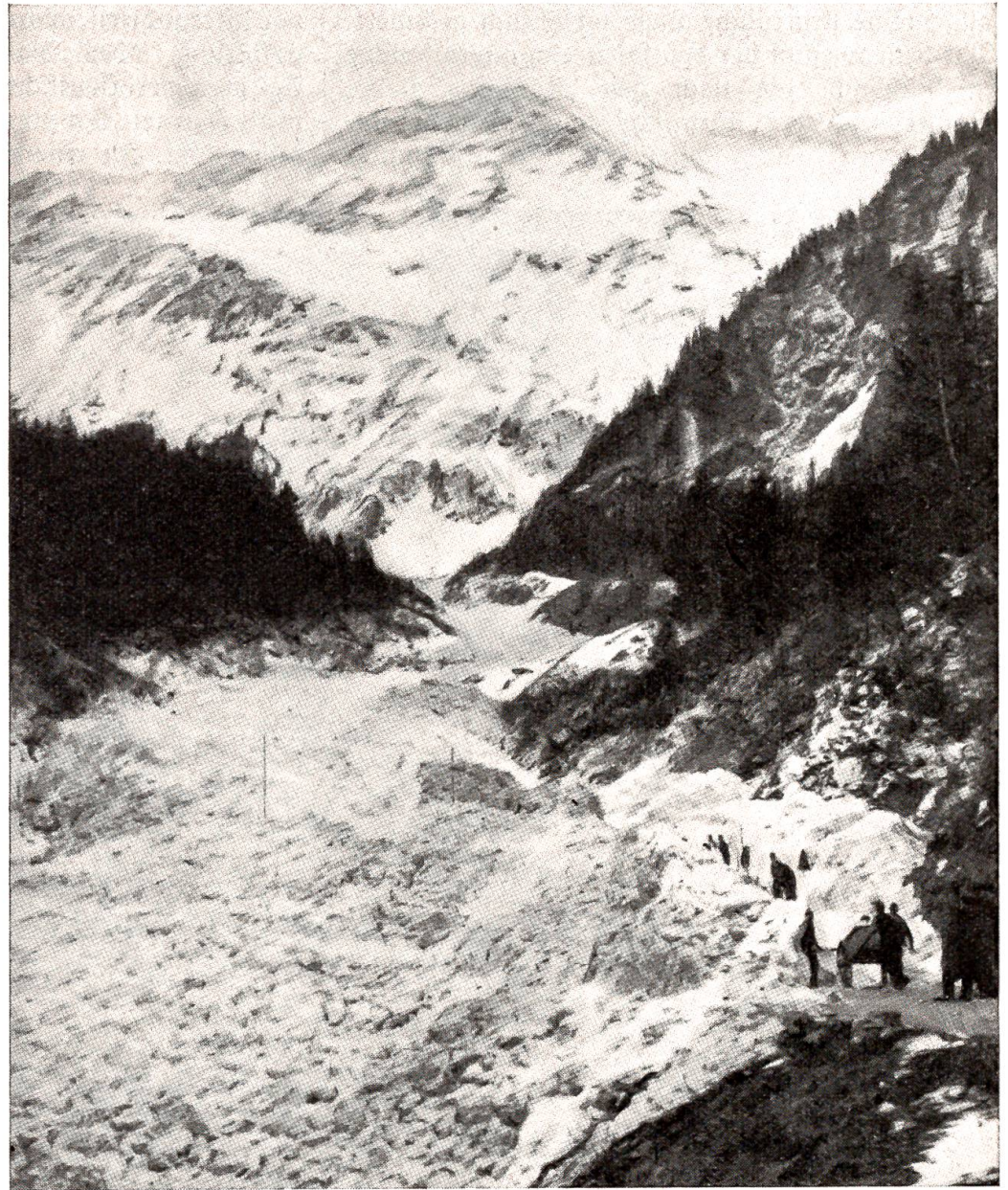
Großer Lawinnenniedergang an der Grimselstraße, 4. April 1943.

die Deutschen auch an der Zentralfront über die letztjährige „Winterlinie“ hinaus strategisch wichtige Gebiete aufgeben müssen, was in Berlin gelegentlich als „Frontbegradigung“ bezeichnet worden ist. Wesentliche Veränderungen der Frontlinie waren seit dem Monat März nicht mehr zu verzeichnen; beide Kampfparteien haben jedoch umfangreiche Verstärkungen herangeführt,