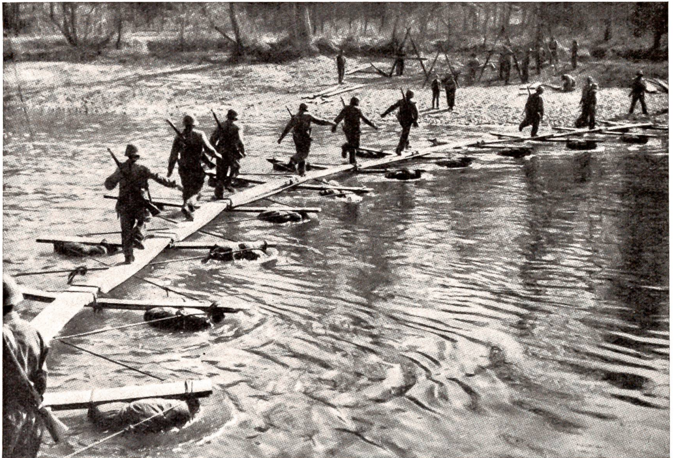
Ein schweizerisches Grenadier-Bataillon nimmt einen Flußübergang im Handstreich über einen improvisiert erbauten Steg aus Zeltbahnen mit Stroh gefüllt. Z. Nr. III/G/7566.

an der die höchsten Offiziere der beiden Achsenstaaten teilgenommen haben. Unter ihnen befand sich auch Großadmiral Dönitz, ein spezieller Förderer der U-Boot-Waffe, der seit Ende Januar an Stelle von Großadmiral Raeder das Oberkommando der deutschen Flotte führte. Tatsächlich hatte die deutsche U-Boot-Offensive, die große Sorge der Alliierten, in den ersten drei Monaten 1943 außerordentliche Erfolge zu verzeichnen. Sie riefen aber auch wieder einer verbesserten Abwehr. Im zweiten Viertel des Jahres gingen die Schiffsverluste der Alliierten von Monat zu Monat zurück und erreichten im Juni einen auch von deutscher Seite nicht bestrittenen Tiefstand seit Kriegsbeginn.