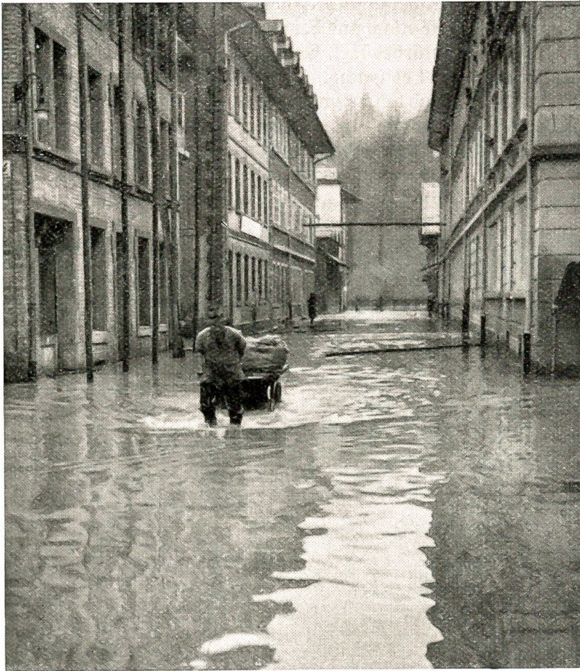
Die Stadt Bern — unter Wasser, November 1944 Die Aare führt Hochwasser! Die Fluten nehmen im Berner Matte- Quartier beängstigende Ausmaße an.