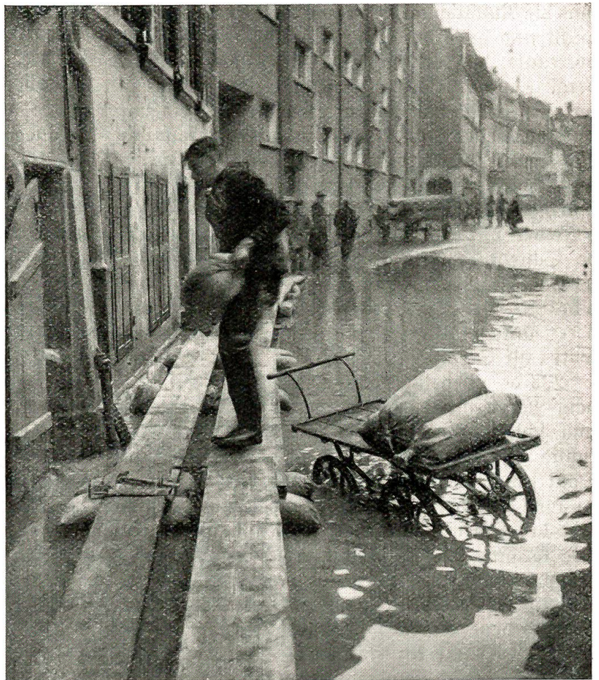
Die Stadt Bern — unter Wasser, November 1944 Die Feuerwehr bei der Errichtung von Notstegen

Duge gmacht! Die Bohne sy nid nume bruun worde wie Meichäfer, sie hei ou afah schmöcke, schmöcke, wie=n-äs no nie öppis gschmöckt het gha. Dür alli Ruum isch dä Gruch gange, und wo der Scheich der erscht Zoon i d'Nase übercho het, isch er ganz läbig worde. Und wo=n-er du erscht no das Schteichüssi a de Füeße gha het und warm worde=n-isch, het er sich vor Wohlige nümme gschpürt. Er het afah zable und mit de Zeije a däm Sedli ume-nusche, er het gschperzt und däm Sedli gäng a der Bettstatt gribset, daß es nume so gchroset het, und derzue het ne ds Lisebethli so fründlech aglachtet, daß er allwäg ufgschtande wär für's ane-n-Arfel z'näh, wenn das gschwullene Bei nid so weh ta hätt.