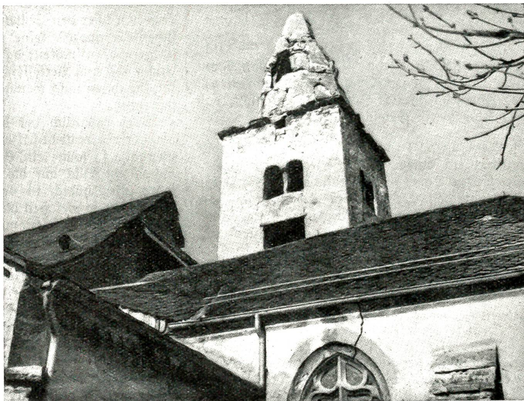
Die Erdbebenkatastrophe im Wallis im Januar 1946

„Großer Gott, wir loben dich!“ singt Kilian