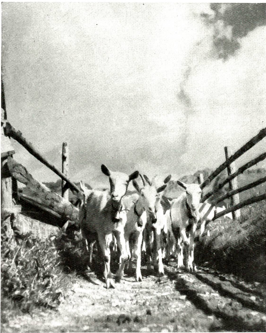
Ziegen im Simmental ziehen zur Weide bergwärts.

Wir haben nun also die Sustenstraße von Meiringen nach Gadmen über den Gebirgskamm, und wer es nicht längst schon gewußt hätte, erlebte es im nun zu Ende gegangenen Sommer des Jahres 1946 gewiß durch eigene Anschauung: über alle unsere stolzen Alpenstraßen ist mit dem Susten ein neuer Regent gesetzt worden. Die neue Chaussee hat eine Streckenlänge von sechsundvierzig Kilometern, davon achtundzwanzig auf bernischem Gebiet; sie steigt von Innertkirchen (622 m) in eleganter, gestreckter Führung zum Kulminationspunkt hinauf (2262 m) und alsdann durchs Meiental nach Wassen (834 m) hinunter, vom Anfang bis zum Ende immer dem Sonnenhang nach. Die Kulmination liegt in einem Scheiteltunnel, den die geographische Paßhöhe nur hügelartig überlagert. Wer die Höhe