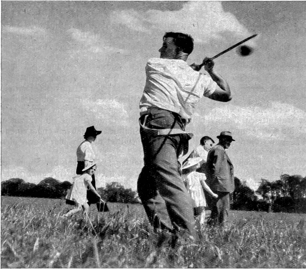
Hornusser beim Schlag