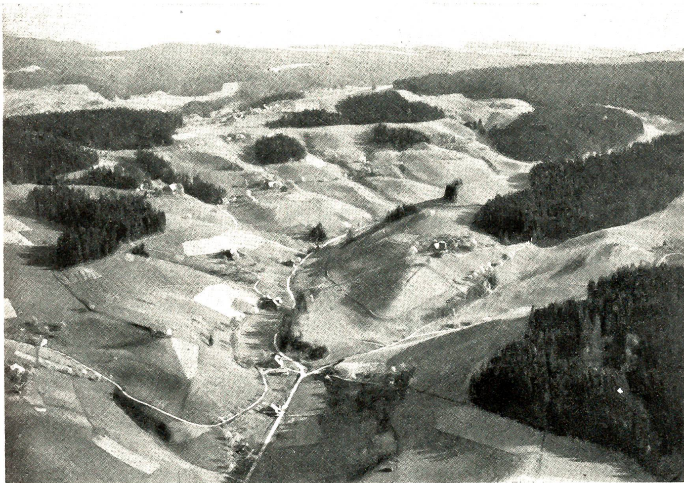
Fliegeransicht der Emmentallandschaft

Hand durchstreiften die jungen Feudalherren die unwegsamen Waldungen auf dem rechten Ufer der Emme, entfaltetten fern allen Stadtdienstes ihr triebstarkes, ungebundenes Wesen und hüteten eifrig die Rechte in den umliegenden Weilern, in Aeschau, Horben, Neuenschwand, Riedmatten, Dieboldsbach und Dieboldswil. Im 13. Jahrhundert besaß ein Zweig der Familie die Talwarte Attinghausen in Uri, ein anderer setzte sich auf Wartenstein fest, einer Wehrbaute, die vom schmalen Grat des Kalchmattberges den mittleren Abschnitt des Emmentals beherrschte. Gegen Ende des 14. Jahrhunderts gaben die Schweinsberg ihre Rechte in der Gegend von Eggwil auf, und an ihre Stelle traten die mit ihnen verwandten