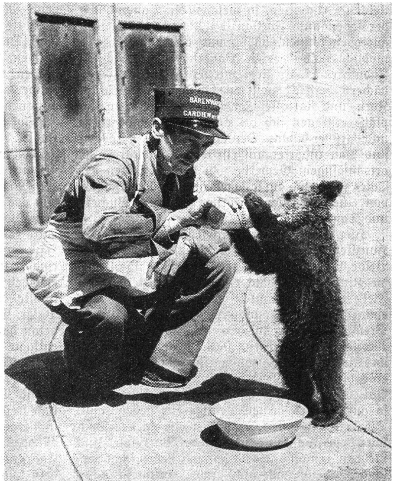
Blutaufrischung im Bärengraben durch jugoslawische Bärli

Berwechslungen. „Weißt du noch, Ernst, unter diesem Baum haben wir uns den ersten Kuß gegeben. . . ach nein, das warst du ja gar nicht!“ — „Doch, Lotte, ich war es schon, aber du warst es nicht!“