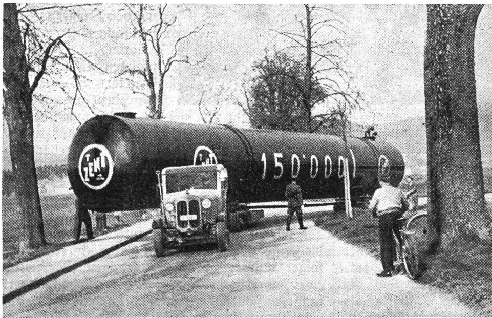
Öltank für die neue Heizölverbrennungsanstalt der Stadt Bern mit 150 000 Liter Inhalt

darin, daß kurz nach dem Wiederbeginn der Verhandlungen in Korea die von China materiell unterstützten Vietminh-Streitkräfte in Indochina eine neue Offensive gegen die französischen Truppen eröffneten und erstmals ins Königreich Laos eindrangen. Der Vorstoß wurde zwar in der ersten Hälfte Mai wieder abgebrochen, doch die Schwierigkeiten wuchsen, da nun, um den Kommunisten den Wind etwas aus den Segeln zu nehmen, auch die Könige von Laos und Kambodscha von den Franzosen die vollständige Unabhängigkeit verlangten.