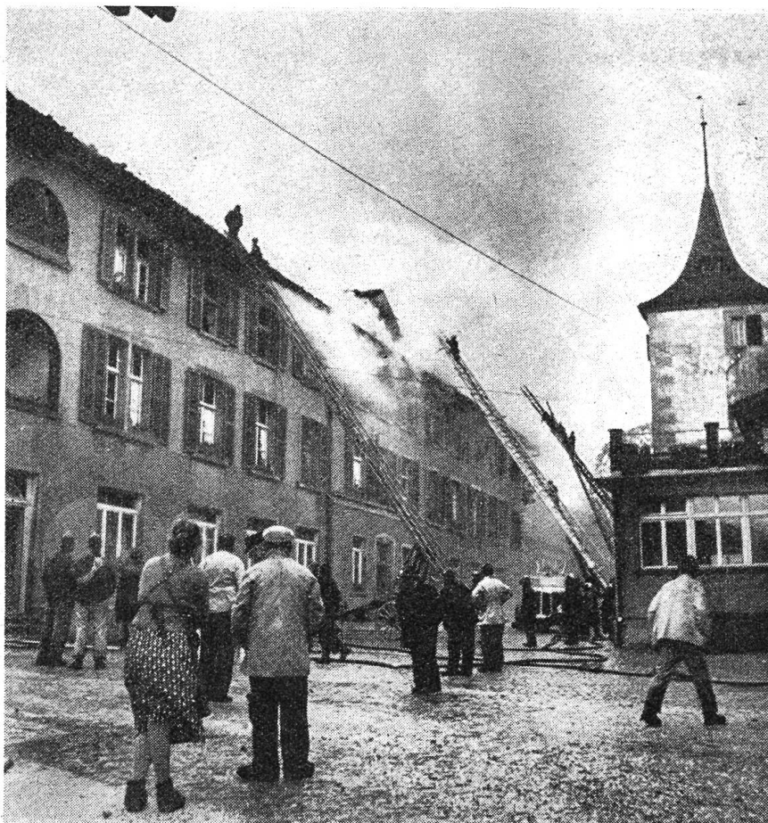
Im Herbst 1952 zerstörte ein Großbrand das Männerhaus des Verpflegungsheims Uhigen (Bern).