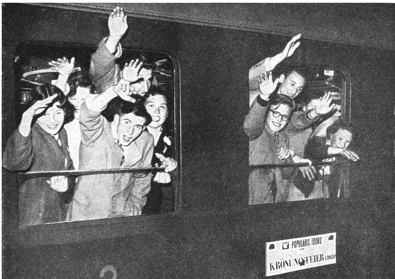
Die Stadtgemeinde London-Edmonton hat zur Krönungsfeier der englischen Königin am 2. Juni 1953 fünfzig junge Schweizer und Schweizerinnen eingeladen.