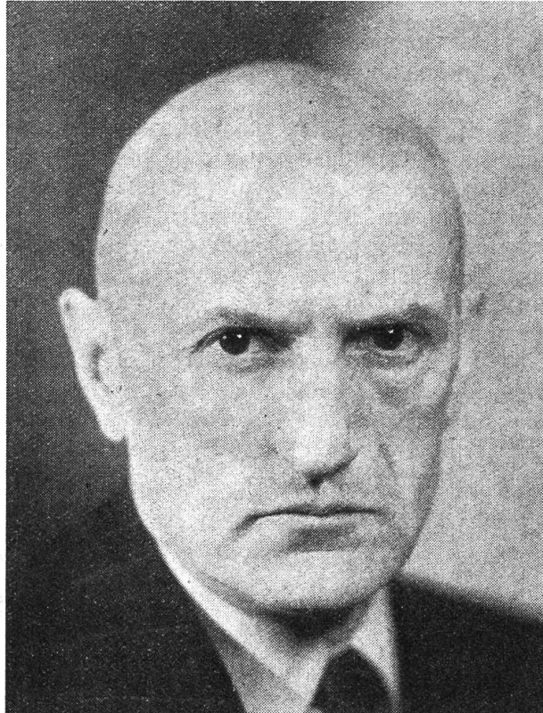
Philipp Etter Bundespräsident für das Jahr 1953

Sinzu kamen gewisse Veränderungen des politischen Klimas an der äußeren Front der kommunistischen Welt. In der Tschechoslowakei, wo