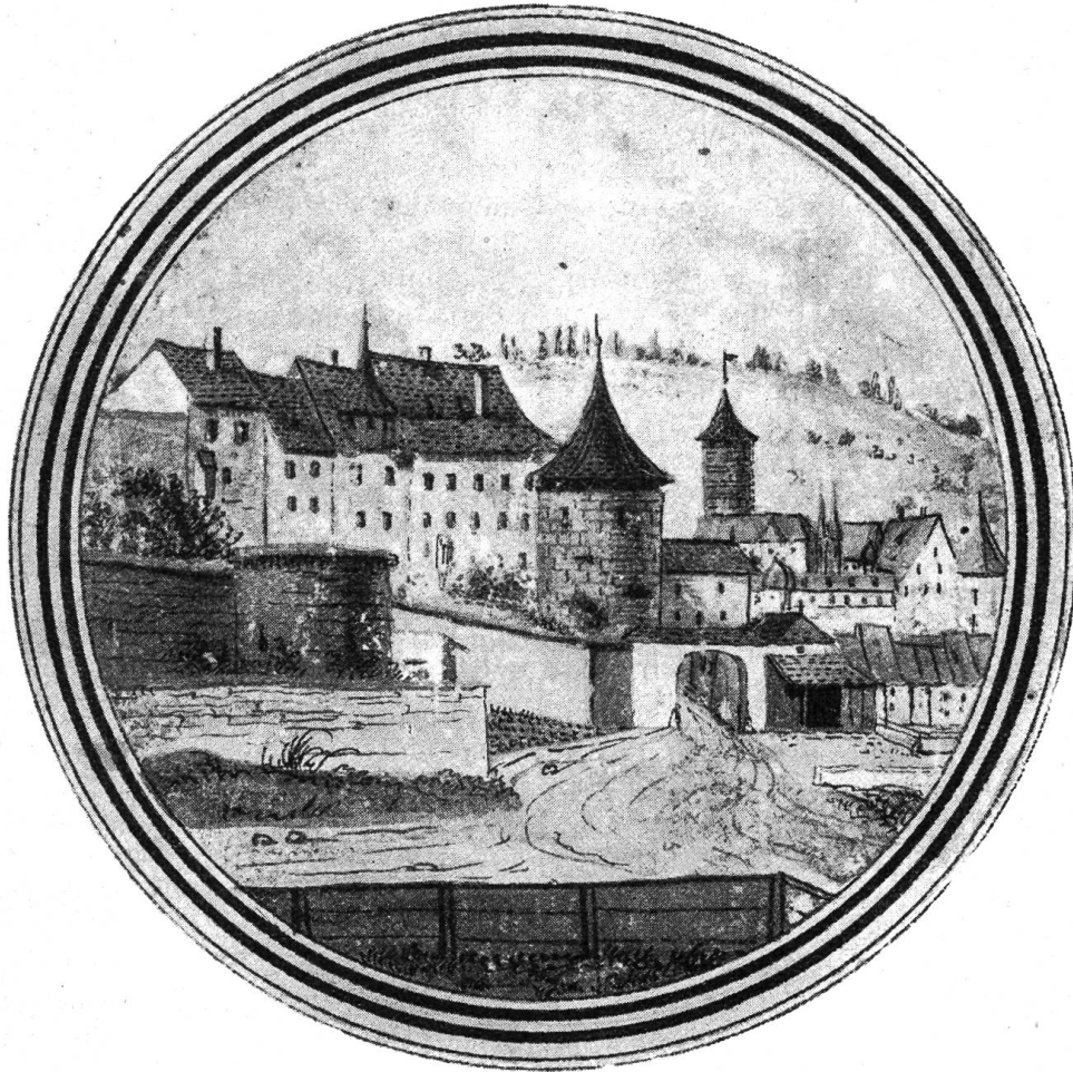
Vue de la Porte S. Germain d'où l'on découvre une partie du château de Porrentrui.

In der alten Dreizehnenwirtschaft kam der Viehzucht keine selbständige Bedeutung zu. Auf