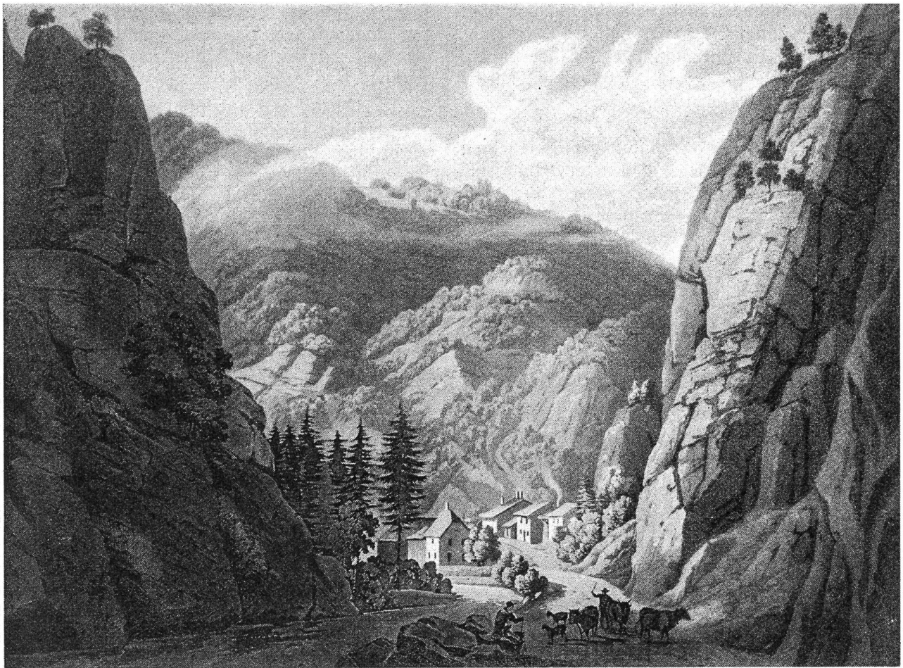
Die Glashütte von Roche im alten Bistum Basel

mischen Erinnerungen, aus französischen und deutschen Einflüssen ein eigenartiges Idiom entwickelt hat. Dieses lehnt sich an die östlichen Dialekte des Lothringischen und an das Burgundische an, nasalisiert „an“ und „on“ und läßt das „r“ wie einen Trommelwirbel rollen. Saftig ist diese Sprache und voll eigentümlicher Reize, und Rabelais hätte ein göttliches Vergnügen gehabt, sich ihrer bildhaften Wendungen zu bedienen.